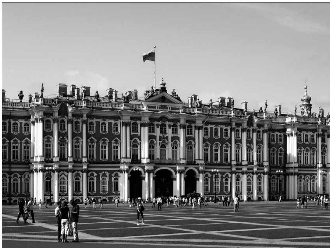
Palais de l'Ermitage à St. Petersburg. «Si la Russie utilise son potentiel, cela signifiera d'intéressants aspects politiques, sociaux et économiques pour l'UE et le reste du monde.», déclare Jim O'Neill, ancien économiste en chef de la banque d'investissement américaine Goldman Sachs.

prononcé en faveur de la division de la zone euro en une zone nord et une zone sud.