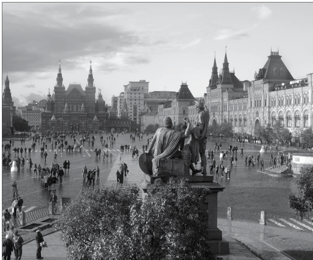
La place Rouge à Moscou

La Russie et la Suisse moderne ont une relation toute particulière, ce qui remonte à l'époque de Napoléon. Pendant la Deuxième Guerre de coalition en 1799, la Russie a essayé, par ensemble avec son alliée, l'Autriche, de chasser Napoléon de Suisse, ce qui malheureusement a échoué. Le maréchal Souvorov, commandeur des troupes russes, a exigé des efforts presque surhumains de lui-même et de ses soldats dans le combat contre les troupes françaises. A plusieurs reprises ils devaient se réfugier en passant par des cols enneigés pour ne pas se retrouver dans un guet-apens français. Dans les gorges de