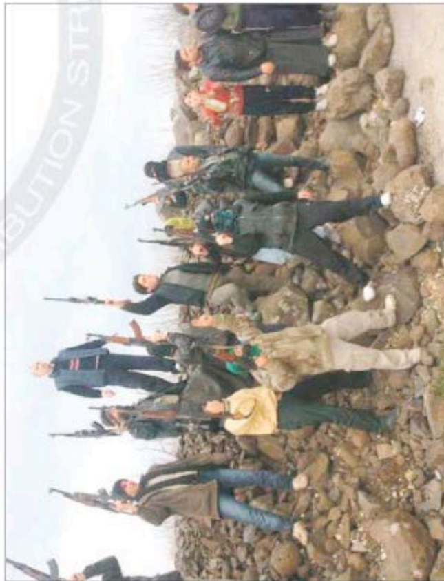
Syrian soldiers who defected to join the Free Syrian Army join demonstrators protesting President Bashar al-Assad in the northern province of Idlib. Assad still holds the loyalties of the officer corps.

In the outskirts of old Damascus, where some of the first protests last year were quickly sup-