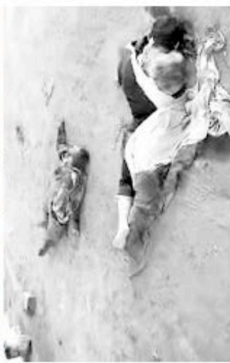
Les violences inédites aux abords de Damas ont fait de nombreuses victimes. Sur l'axe AP

Par ailleurs, 26 soldats ont été tués dans trois attaques différentes, 9 rebelles ont trouvé la mort ainsi que 5 membres des forces de sécurité, selon la même source. Signalons que jusqu'à la capitale avait été relative-