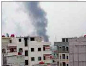
Humo sobre los suburbios de Damasco.

Respaldo por su aliado iraní, el régimen de Damasco rechaza cualquier intervención internacional en la crisis. La agencia Sana citó ayer al ministro de Asuntos Exteriores iraní, Ali Akbar Salehi, advirtiendo de que la situación debe resolverse de forma pacífica y sin la participación de potencias extranjeras. «Las presiones internacionales contra Siria pueden llevar a consecuencias negativas y temblores en toda la región», aseguró.