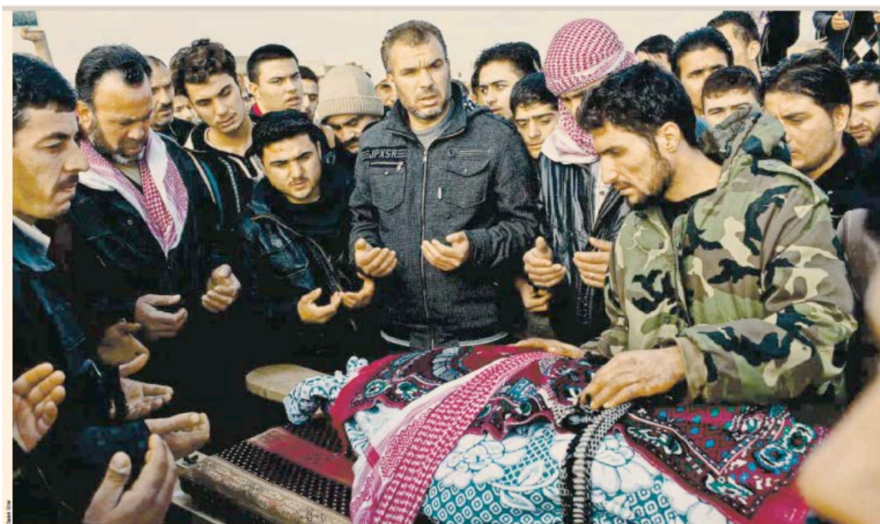
Erschossen auf dem Weg zur Arbeit: Bewohner eines kleinen Ortes in der syrischen Unruheprovinz Idlib trängen sich um ein aufgebahntes Opfer des Aufstands