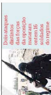
Dois ataques distintos das forças da oposição mataram ontem 16 soldados do regime

bertação e uma série de milícias que actuam por conta própria têm vindo a intensificar-se em todo o país.