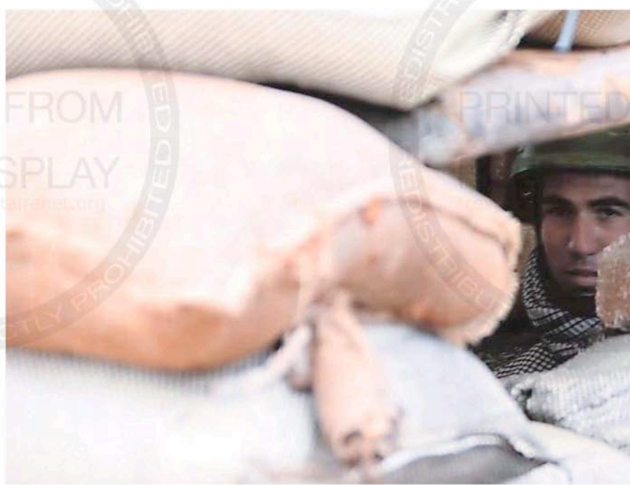
Un militar se protege entre sacos terreros en la ciudad de Dara, donde empezó la revolución

Como en Túnez, Egipto y Libia, el control de la capital del país es básico para el triunfo de las aspiraciones opositoras. El régimen es consciente y por eso trata de blindar Damasco en una semana crucial en la que la Liga Árabe y la Unión Europea presentarán un plan conjunto ante el Consejo de Seguridad de Naciones Unidas. El plan tiene como primer punto la dimisión del presidente Bashar al-Assad y la formación de un gobierno de unidad nacional, algo a lo que Rusia y China se han opuesto de forma tajante ya que piden una oportunidad para el plan de reformas propuesto por el presidente.