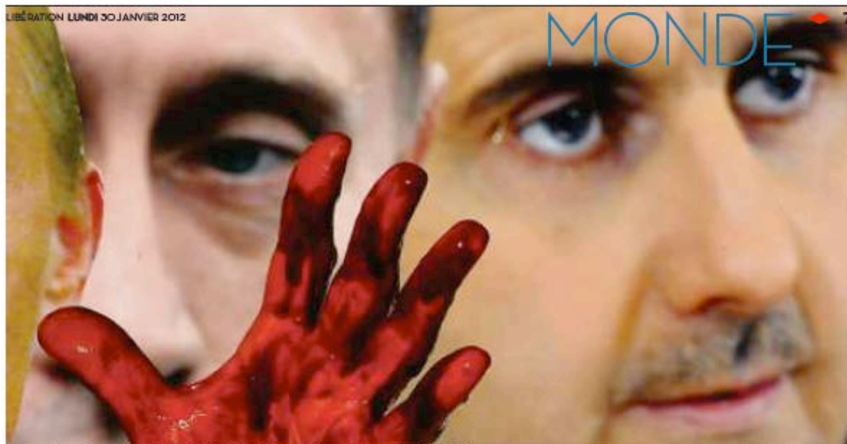
La main d'un manifestant d'avant le siège de l'ONU, mardi, dénonçant le soutien de Poutine à Al-Assad.