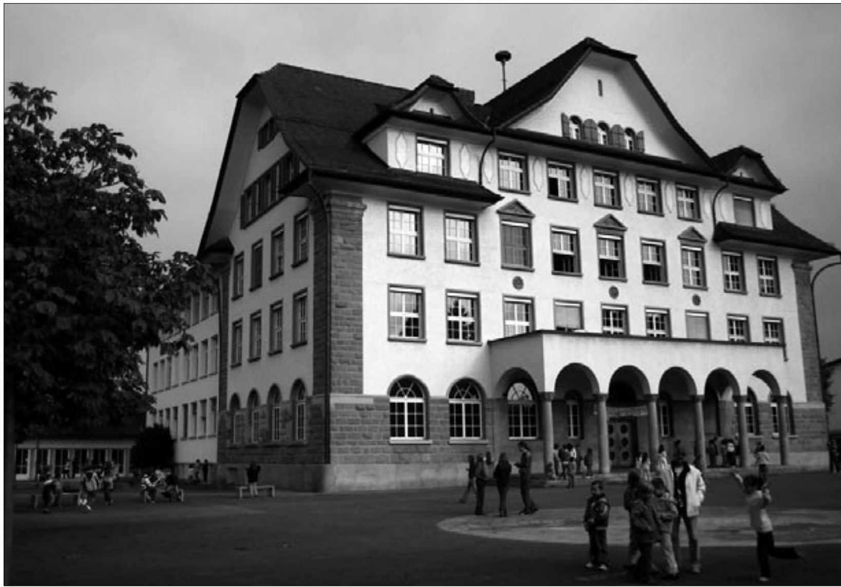
Les élèves sont de plus en plus victimes de processus de développement organisationnel. On qualifie par euphémisme cette évolution de «développement scolaire». Ce processus a lieu dans toute l'Europe. Des grands groupes comme les éditions Bertelsmann le pilotent et en profitent. L'objectif de leur école n'est pas de faire des élèves de futurs citoyens éclairés et responsables. Il faut donc exiger de la transparence. C'est le peuple qui doit décider de l'avenir de l'école primaire.