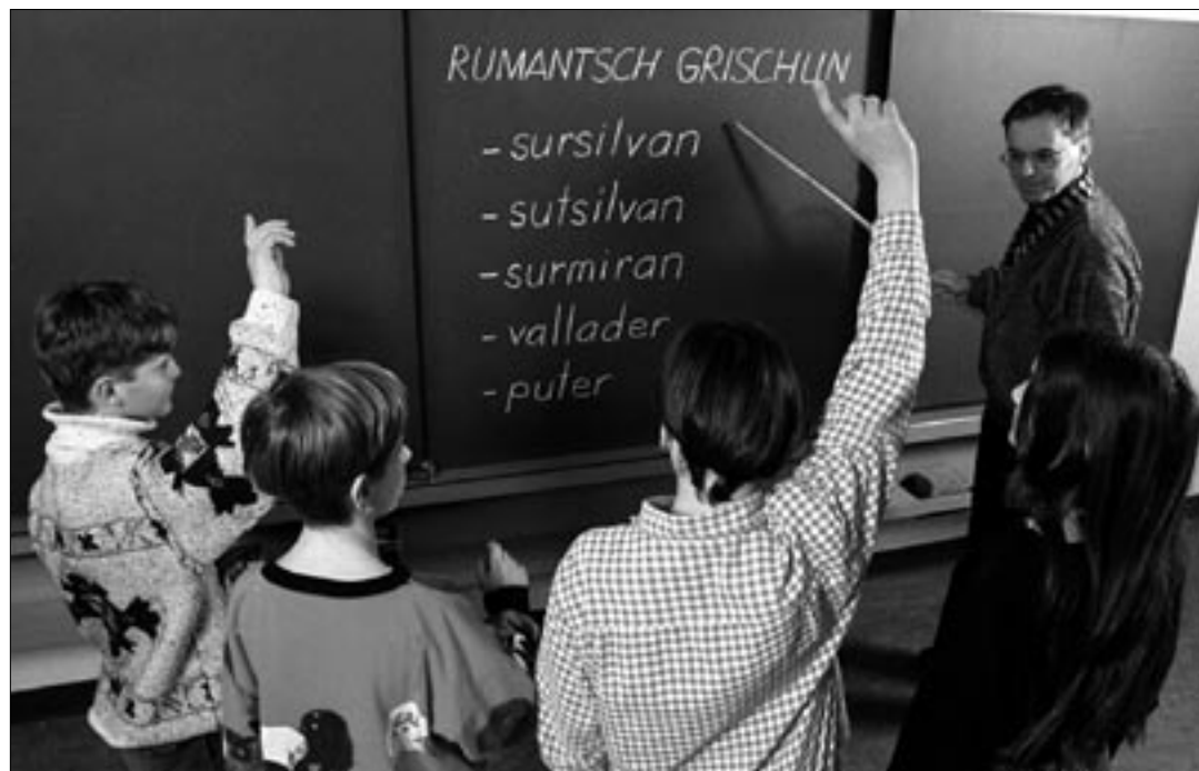
Ecole du canton des Grisons. Les cantons ont créé des structures scolaires diverses qui correspondent aux situations et aux besoins locaux.

Cette éducation vise à ce que chacun soit apte à aborder de manière approfondie les questions politiques afin de mieux pouvoir prendre des décisions. Quelle que soit son