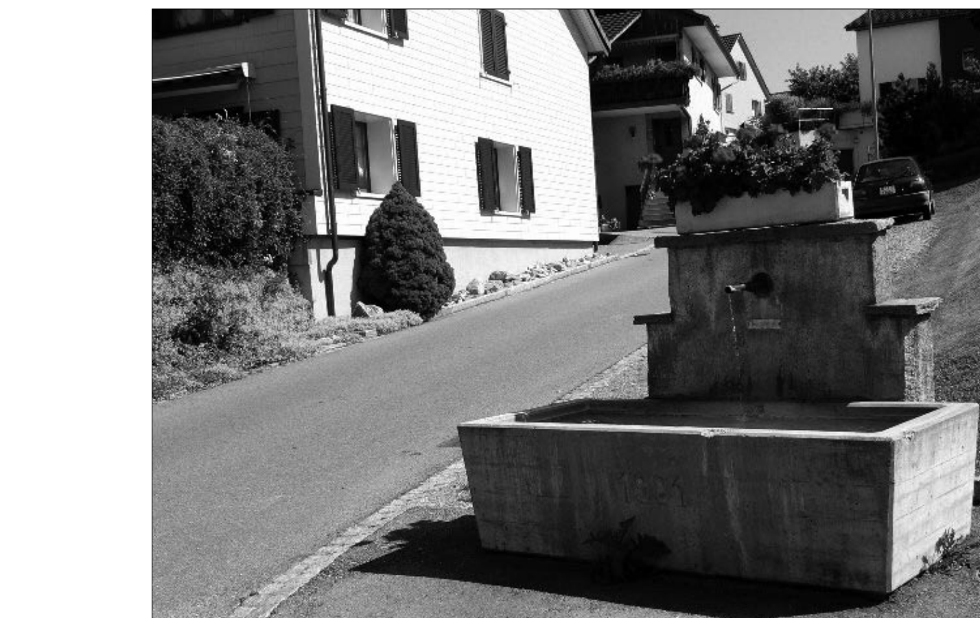
Discussion à l'Assemblée communale concernant l'eau: «On n'a pas entendu d'injures, la discussion était rude mais correcte et l'accord était fait de façon que tout le monde a pu garder la face, même la commune.»

village d'une autre manière. La votation a eu lieu. Une majorité écrasante des citoyens a accepté le terrain de football. Nous appartenions à la minorité qui a voté contre.