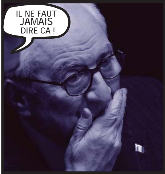
*Corriere della Sera, décembre 2007.