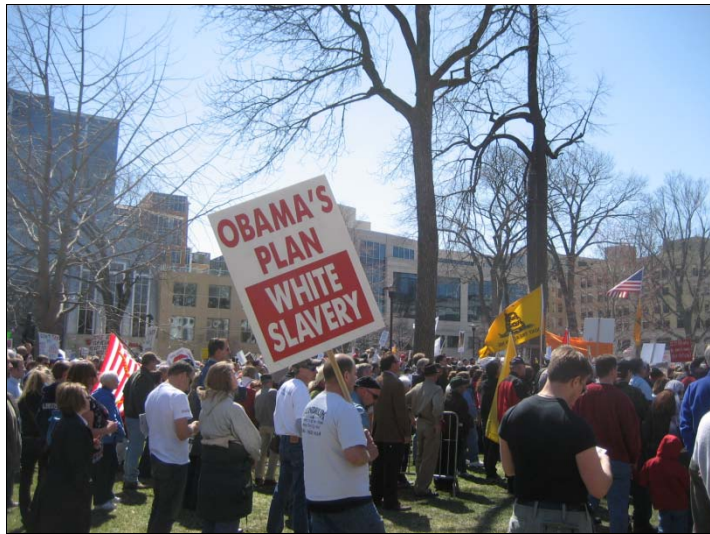
Tea Party de Madison, 15 avril 2009