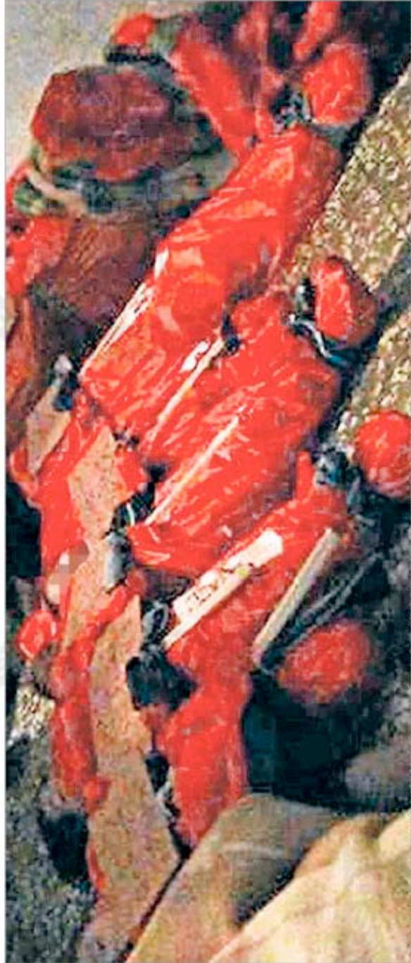
The bodies of members of the Bahar family wrapped in shrouds in the city of Hama. Witnesses fear they were victims of sectarian violence, killed by militiamen from President Bashar al-Assad's Alawite Shia minority

In the past 10 months, more than 5,000 civilians have died. The United Nations, which called the figure, said that it was up to Syria to bring a truce, and it gave up trying to update the tally weeks ago. But the frosty with which the Bahar