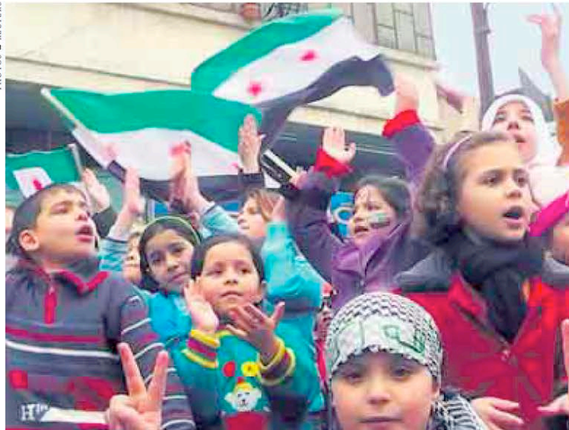
Children chant slogans as Syrian independence flags are waved behind them during a protest against Syrian President Bashar al-Assad in Khalidiyah, near Homs.