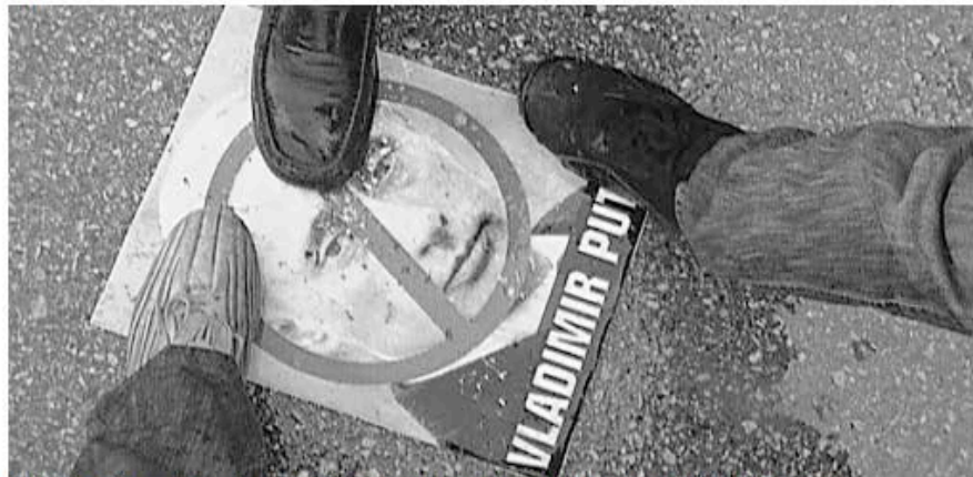
A Idlib, face à l'intransigeance de Moscou, des manifestants antirégime ont piétiné un portrait de Vladimir Poutine.

Des manifestations ont également eu lieu à Palmyre, Jäsem, Hassaka, Idlib, Malechia, Douma, Homs, où des snipers