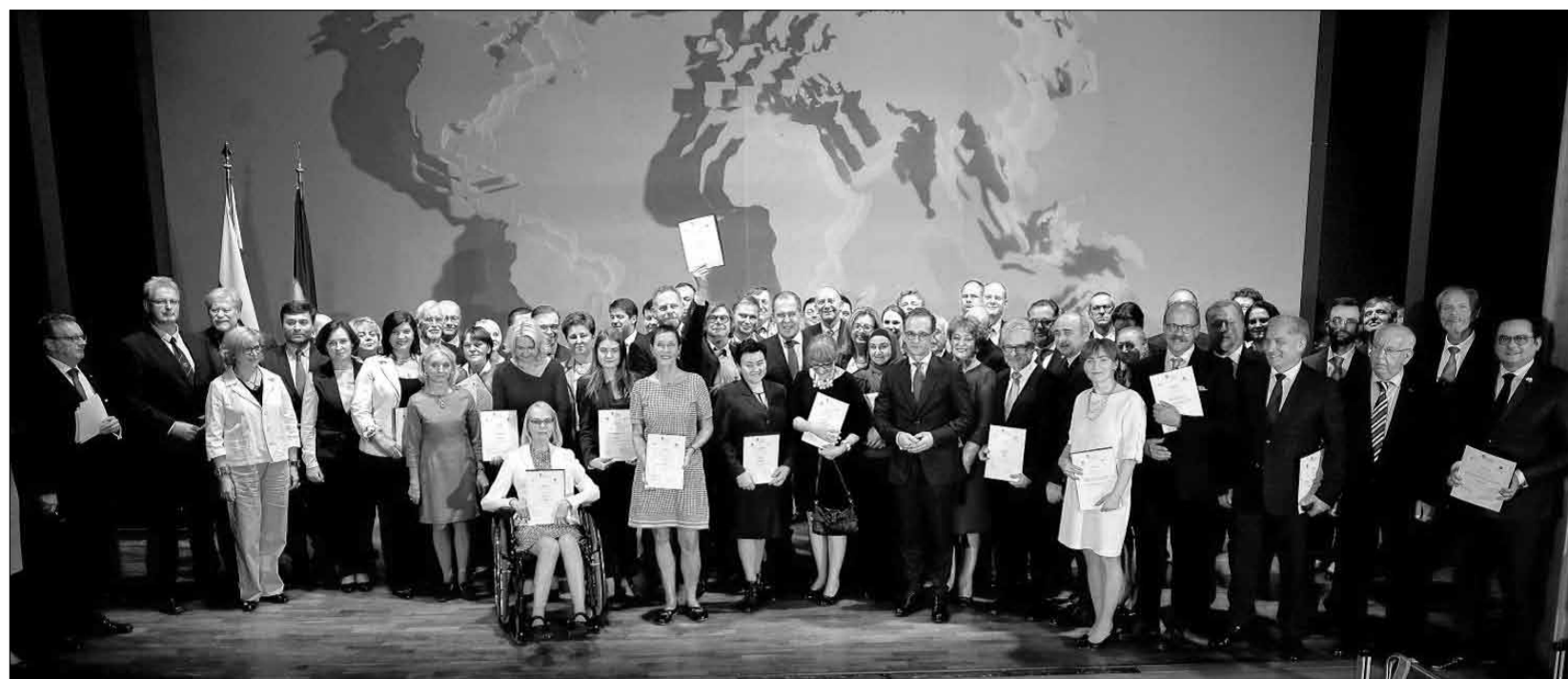
Les représentants de projets ayant obtenu une distinction – une «partie du tout» de l'almanach de la coopération germano-russe. Parmi eux, les deux ministres des Affaires étrangères Sergueï Lavrov et Heiko Maas.

C'est justement dans le domaine de la collaboration germano-russe dans les questions sociales concernant les personnes avec han-