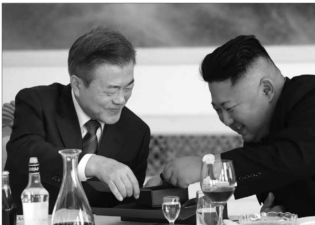
Moon Jae-in et Kim Jong-un travaillent en bonne entente.

1.2 Les deux Corées se sont entendues pour s'engager dans un processus de communication constante et de collaboration étroite pour réviser l'implémentation de l'Accord