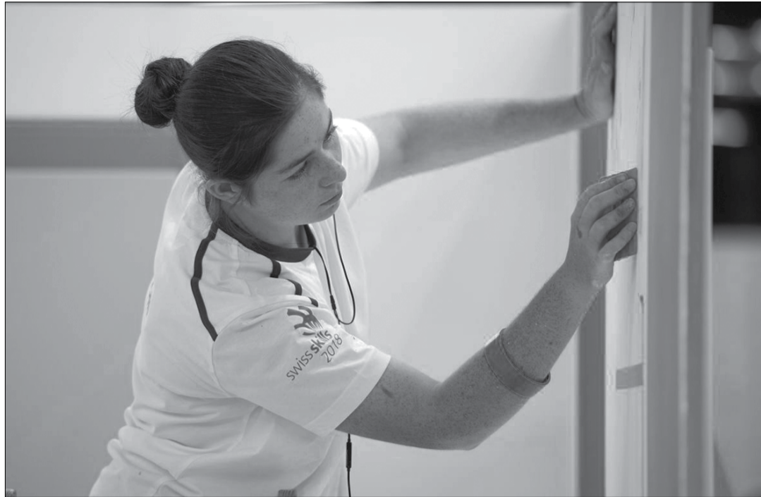
Une jeune femme peintre lors du concours de SwissSkills à Berne.

«Le système de formation dualiste en Suisse est unique. Les jeunes professionnels le prouvent régulièrement au championnat suisse, européen et mondial dans tous les secteurs professionnels.» Voilà comment SwissSkills exprime la grande valeur du système de formation duale en Suisse. 1 Les performances exceptionnelles résultent d'un apprentissage de trois ou quatre ans pendant lequel les jeunes sont accompagnés personnellement et avec enthousiasme pour leur profession par leur maître d'apprentissage qui leur transmet une formation approfondie, complétée à l'école