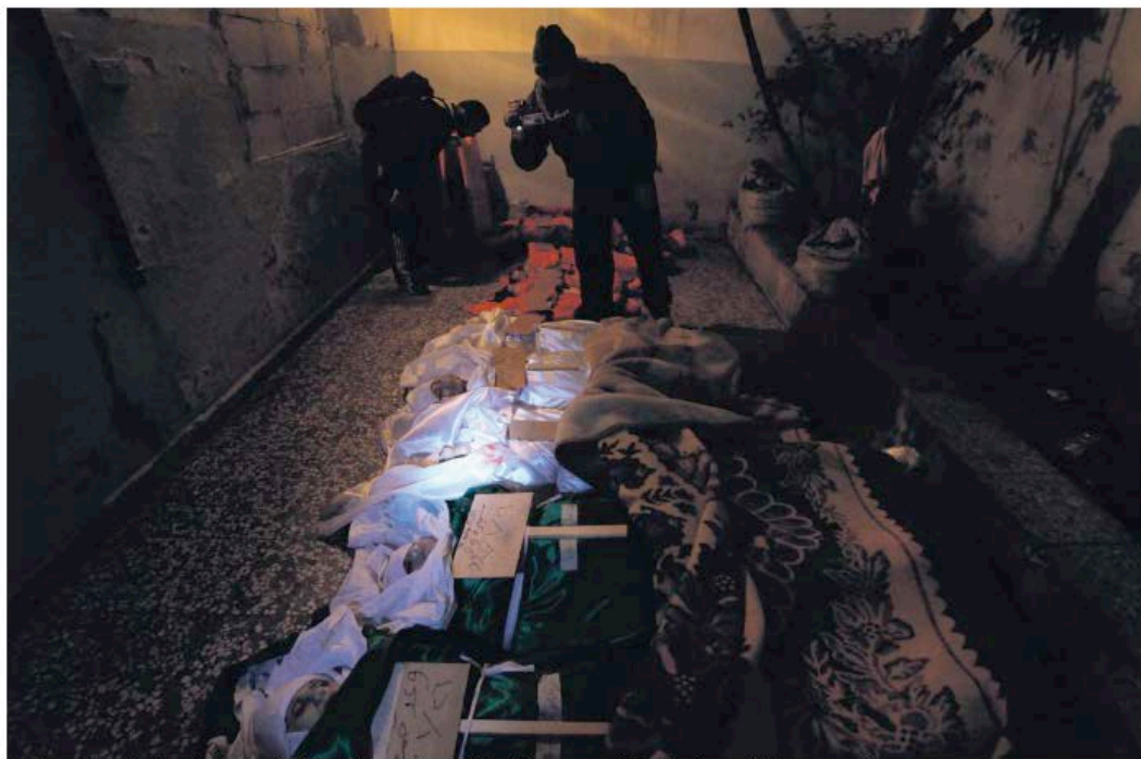
Dans la cour du centre de santé de Karam Al-Zaitoun, les corps d'une famille syrienne massacrée, le 26 janvier, par des hommes en uniforme.

Il est 19 heures lorsque j'aperçois un responsable de l'ALS, Abou Layl. Il propose de me conduire au centre de santé où ont été transportées les victimes du massacre. Quatre opposants, dont trois soldats de l'ALS, se joignent à nous. Nous grimpons à bord d'une voiture qui parcourt à grande vitesse des ruelles obscures. Nous éteignons tous les feux du véhicule dès que nous nous approchons d'un barrage tenu par les forces loyalistes. L'astrologue un soldat qui continue de consulter l'écran lumineux de son portable. Aucune lumière ne doit nous trahir. Un des soldats à l'avant de la voiture masque de sa main la montre lumineuse du tableau de bord tandis que nous traversons une première avenue dangereuse : l'avenue Wadi, rebaptisée "Charia Al-Maour", "avenue de la mort". Plié en deux sur mon siège, j'entends les prières psalmodiées par mon voisin de gauche. A peine arrivé de l'autre côté de l'avenue, on