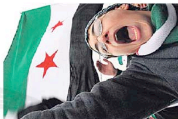
Protesto anti-Assad na Jordânia

No conflito morreram pelo menos 5700 pessoas, 384 delas crianças, de acordo com os dados divulgados ontem por Marixir Mercado, porta-voz da Unicef, a agência da ONU para a infância. Mercado disse que o número se baseia em relatórios das organizações de direitos humanos e que a maior parte das crianças mortas são rapazes. "Perto de 380 crianças estão detidas, algumas com menos de 14 anos", acrescentou.