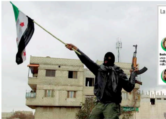
Disertore Un soldato siriano che si è unito ai ribelli venerdì scorso a Saqba, nei dintorni di Damasco

QARDAHA — Il mausoleo ottagonale domina il centro del villaggio come un tragico memento di morte e allo stesso tempo di nostalgia per un passato più felice. Il marmo bianco e nero è tirato a lucido ogni giorno da un ampio stuolo di guardiani. Le cupole bombate ricordano quelle delle moschee iraniane. Al centro sta la tomba di Hafez Al Assad, il padre della patria, il patriarca della Siria contemporanea, il fine politico celebre per la sua capacità di trasformare la debolezza in forza, tanto da imporre dal 1970 sulla maggioranza sunnita (oltre il 70% dei siriani) il governo della minoranza alawita che non supera il 12% della po-