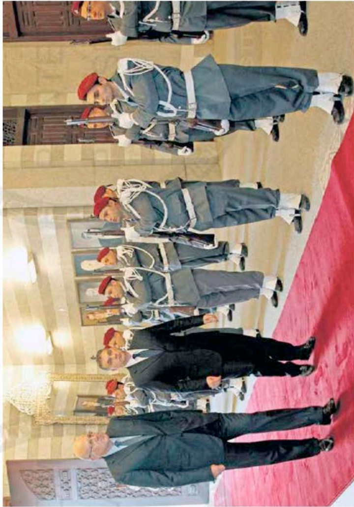
The Lebanese prime minister Najib Mikati, left, said the historical and geographical ties between Lebanon and Syria has been a factor in forming a policy that is in the "interest of Lebanon".

The opposition March 14-bloc has voiced support for the uprising and last week welcomed a statement issued by the main political opposition group, the Syrian National Council, that called for a "new page" in Lebanon-Syria relations. Mr. Mikati would not be drawn on the comments, but said that this policy of "disassociation" is the only way to preserve the period of relative stability that Lebanon is witnessing. "What concerns me in Syria today, the most important [thing] is stopping this kind of bloodshed," he said. "That is the most important for me. Every day we are hearing killing from both parties. This should stop."