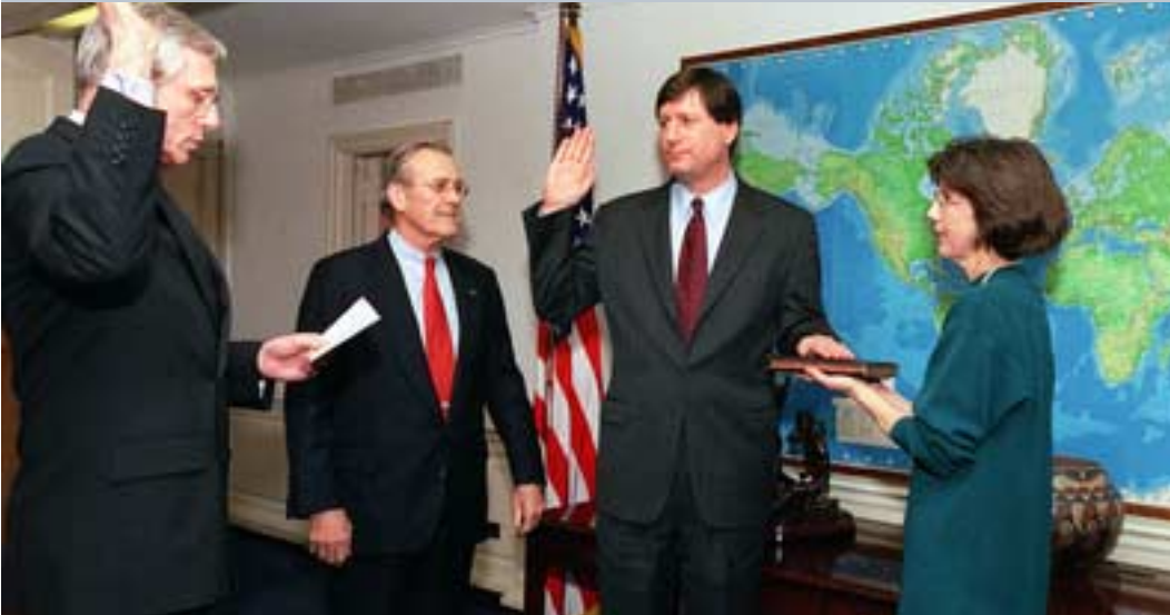
ستيفان كامبون يقسم اليمين بحضرة رامسفيلد

نظرية مكتب رامسفيلد الخاص لا تكفي الحرب الوقائية بما أنه من الصعب الحصول على المعلومات الكافية والدقيقة لتحديد الخطر الذي يبررها، يجب إذن، حسب رأيهم، خوض حروب استعلامية والتي سيكون لها دور الحصول على المعلومات حول التهديدات التي يجب القيام بحروب وقائية ضدها.