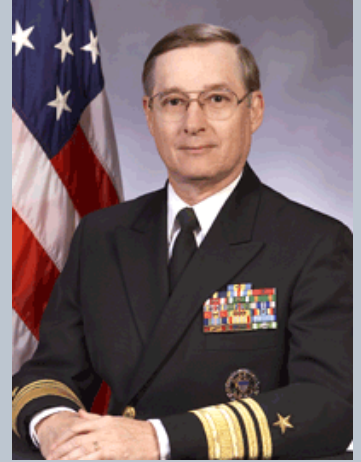
جاكوبي ولكل إمراء من إسمه نصيب

فرع الدعم الاستراتيجي Strategic Support Branch يبدو منتشرا في عشرات الدول، منها الصومال، اليمن، اندونيسيا، الضلبيين، وجورجيا.