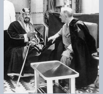
روزفلت - الملك عبد العزيز