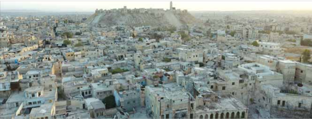
جانب من أحياء حلب القديمة التي تتوسطها القلعة التي يسيطر عليها الجيش السوري

«هندسة» حدودها الجنوبية مع حلب بما يناسب مهنتها المستقبلية كجناح عسكري للإخوان في الشمال الحلبى لكن «الزكي» راحت تنافسها أخيراً في الأدوار والمطامح. وفي طهران قال الناطق باسم الخارجية الإيرانية بهرام قاسمي، في مؤتمره الصحفي الأسبوعي أمس، وفق ما نقلت «سبوتنيك»، إن اقتراح المبعوث الأممي حول شرق حلب، مؤكداً أن «أي اقتراح سواء من دي ميستورا أو من غيره لن يأخذ أي أهمية خاصة لأن الساحة الميدانية والسياسية السورية معقدة جداً».