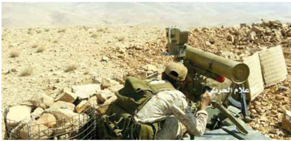
من معارك الجيش السوري والمقاومة اللبنانية في القلمون الغربي (عن الانترنت)

أكد مصدر أهلي في شرقي العاصمة السورية وهو عند طلب موسكو، وفي أنقرة شدد الرئيس التركي رجب طيب أردوغان، على أن بلاده لن تسمح أبداً لحزب العمال الكردستاني، و«وحدات حماية الشعب» بقيادة منصفه على الجبهتين طوال النهار، مع مسؤولين محليين، أن تأسيس منظمة تخفيض التصعيد في الغوطة الشرقية بمراميات صاروخية مركزة، بموازة ذلك وبعدمها أعلنت القنزة المركزية لقاعدة حميميم» أول أمس في حسابها على تلغرام، أنه تم إنذار مقاتلي التنظيمات المسلحة في الغوطة الشرقية بعمليات التطهير في المناطق الشمالية من البلاد مع وجود ضمانات تقدمها روسيا للعبور الآمن لهم إلى مدينة «إلب»، عادت «القناة» أمس لتؤكد أن مسلحي «النصرة» لم يقدموا أي مؤشرات على قبولهم بالخروج الآمن من المنطقة المحددة، مؤكدة أن برامج الدعم السرية المعبر بعدما سيطروا في المحور الشرقي على مرتفع شعبة صدر بيت بدران غرب جبل الموصل وعلى