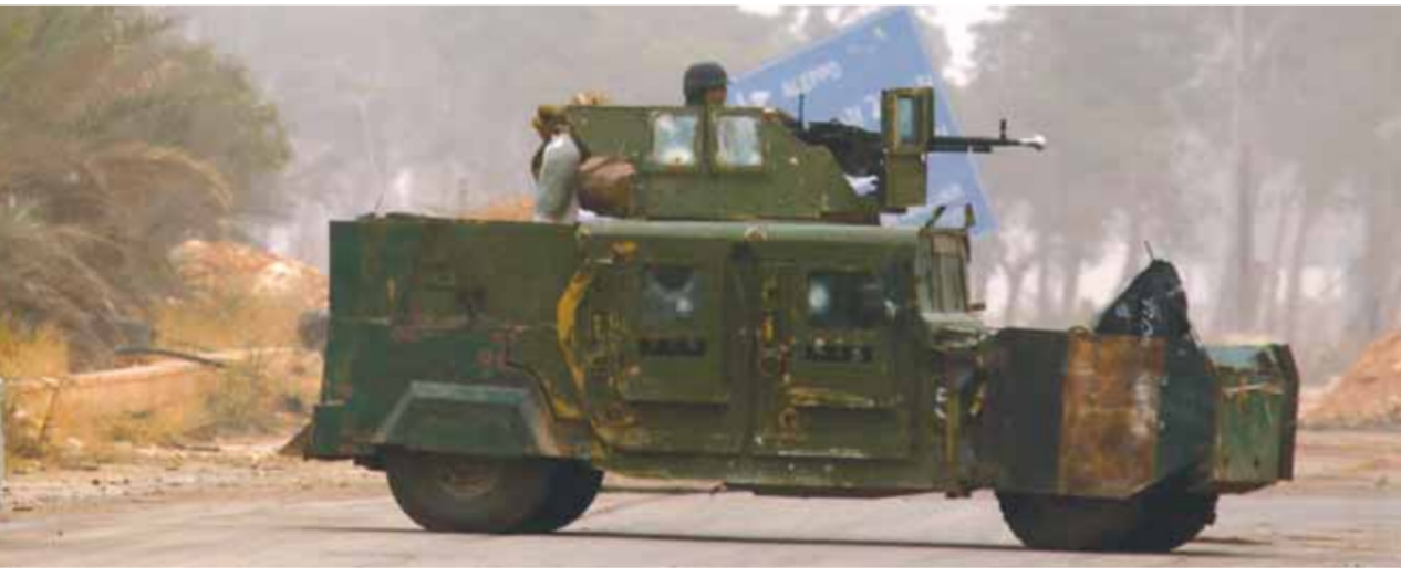
إرهابي يقطع أحد الطرق بمدينة حلب

حلب على أن تستكملت العملية اليوم وغداً، بحسب مصادر معارضة قريبة من «حركة نور الدين الزنكي» إحدى ميليشيات «تحرير سورية» و«الوطنية للتحرير» لـ«الوطن» على حين نفت مصادر أهلية في تلك المناطق لـ«الوطن» صحة مزاعمها. ترامز ذلك مع تعزيز جميع نقاط المراقبة التركية الـ١٢ على تخوم «المنزوعة السلاح» في أرياف إدلب وشمال حماة واللاذقية وجنوب سحمبا بعض سلاحها الثقيل من منطقة الجحول العلمية وبلدة المنصورة شمال حلب ومن منطقة الراشدين ٤ وبلدة خان العسل غرب