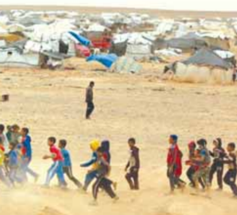
لاجئون سوريون في مخيم الركبان في الأردن

إليها ممثل للولايات المتحدة في الأشهر الأخيرة، والمشاورات مازالت مستمرة»، موضحاً أن الاجتماعات تجري الآن على مستوى الخبراء. ووصف بولوتين تجربة «منطقة خفض التصعيد» الجنوبية بأنها «ناجحة» معتبراً أن «نجاح هذا الأمر يعود للتنسيق بين الاتحاد الروسي والأردن»، وأشار إلى دور دمشق في نجاح العمل في «منطقة خفض التصعيد». بموازاة ذلك أشار وزير الخارجية الأردني أيمن الصفدي في مقابلة مع وكالة «سبوتنيك» الروسية إلى أن «المناقشات الثانية بالوصول إلى الركبان من داخل سورية، معرباً عن أمه أن يتم التوصل إلى اتفاق قريباً حتى تجري تلبية احتياجات سكان