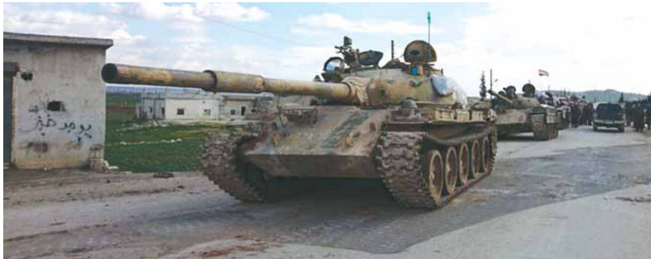
وحدات من الجيش السوري في بلدة البرقوم على مشارف الطريق الدولي حلب- حماه بريف حلب الجنوبي بعد تحريرها من الإرهاب (ساتا)

وسمع الجيش العربي السوري سيطرته في الضفة الغربية لطريق عام حلب سراقب، ومد نفوذه إلى العديد من البلدات المهمة لتأمين مدينة حلب من تهديد الإرهابيين.