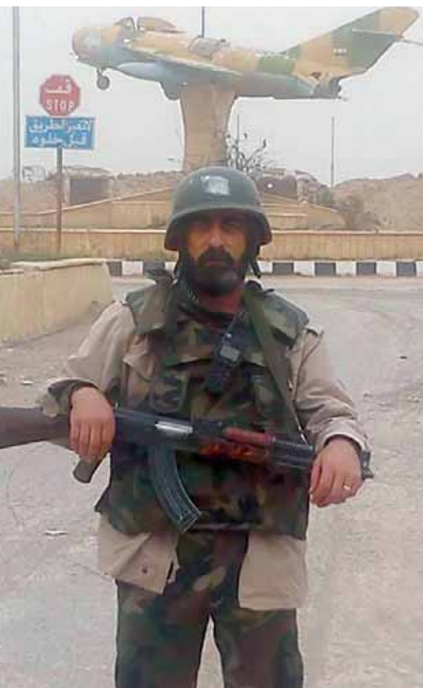
أحد بؤسائل الجيش السوري على مدخل مطار دير الزور (عن الوثق)

وقت كثفت وحدات أخرى من قصفها لمخار المسلحين بالصواريخ والمدفعية الثقيلة في بلدة زبددين ما أدى إلى تدمير تلك المخار والتجمعات بمن فيها. جنوباً، ذكر مصدر عسكري بحسب وكالة «سانا» للأنباء: أن «وحدات من الجيش والقوات المسلحة تابعت توجيه ضرباتها النارية المتكفة على معازل التنظيمات الإرهابية بريف إدلب، وأحرار الشام الإرهابيين مطالبين بطردهم خارج المنطقة». وفي إطار التوتر والقتال المستعمر في ريف إدلب بين المجموعات المسلحة، أعلنت حركة «حزم» أمس اعتقالها