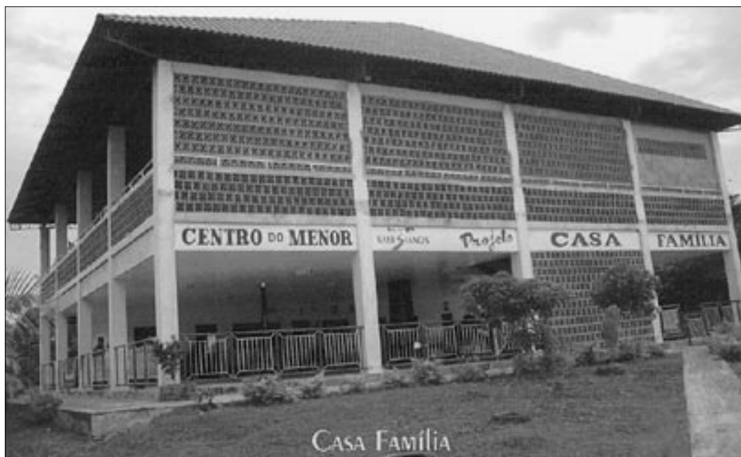
La Casa Família , la maison de la famille. Une œuvre de Père Marcelo au bord de la forêt vierge, à 5 km de Porto-Velho . Deux grandes familles y vivent. Elles se composent d'un couple avec 1-3 enfants à eux et 5-6 orphelins ou enfants de mères célibataires.

A retourner à: Horizons et débats , case postale 729, CH-8044 Zurich, Fax +41-44-350 65 51 CCP 87-748485-6, Horizons et débats , 8044 Zurich