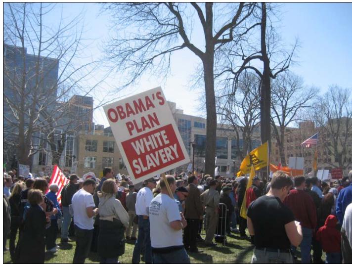
Tea Party de Madison, 15 avril 2009

Ainsi, si la plupart des slogans anti-Obama s'arrêtent juste avant le commentaire raciste, le Président est volontiers assimilé à un étranger. Il serait en soi représentatif de ces éléments exogènes qui menacent de dénaturer le rêve américain. Dans son article sur le caractère novateur du mouvement des tea parties , Michael Tomasky faisait d'ailleurs remarquer que les manifestants étaient tous, quasiment sans exception, blancs. C'est effectivement ce qui ressort de la plupart des reportages photos et vidéo. Si le sentiment anti-immigrés a repris de la vigueur ces derniers mois, d'une manière somme toute assez classique en période de crise, cette hostilité à Barack Obama recouvrirait donc aussi une anxiété identitaire. Devant les acquis de la lutte pour les droits civiques dans les années 1960 et devant la progression de l'immigration, notamment asiatique et latino dans les grands centres urbains des côtes Est et Ouest, l'Amérique blanche rurale serait en train de mesurer que c'est elle qui risque désormais de devenir minoritaire. Dans cette perspective, la notion de désaffiliation reprend tout son sens. Cette Amérique, qui pense être dépositaire d'une dissidence religieuse puis politique qui a changé la face du monde, se voit désormais vulnérable et menacée, donc appelée à réagir pour restaurer l'essence de son système politique et social.