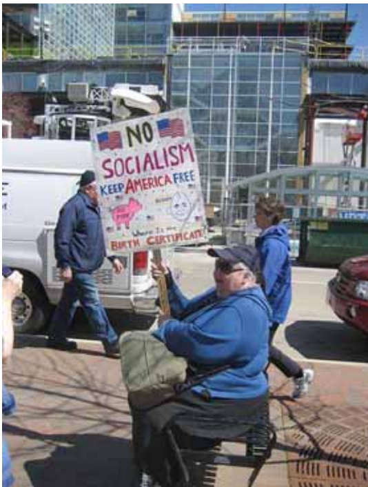
Tea Party de Madison, 15 avril 2009