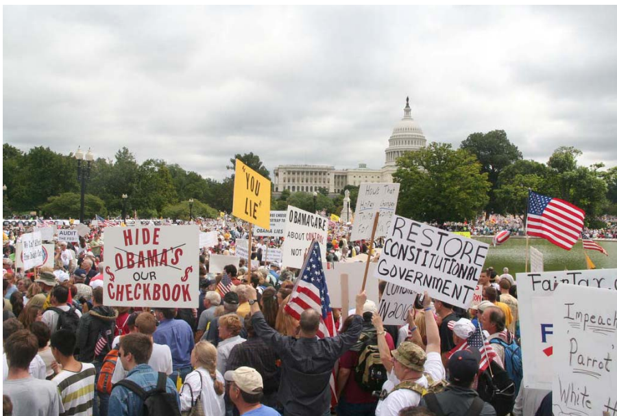
Marche des contribuables à Washington, 12 septembre 2009

nouveau été un grand succès, malgré les dissensions encore vives sur le nombre de participants. Celui-ci varie, de 75,000 selon une première estimation des pompiers, à 2 millions selon certains organisateurs 5 . La date de la manifestation avait été choisie en référence au projet « 9/12 » du présentateur Glenn Beck, la nouvelle star de Fox News. Beck propose en effet à l'Amérique éternelle de renouer avec ses origines constitutionnelles en resserrant les rangs autour d'un pacte de 9 valeurs et 12 croyances, reformulées en un double hommage : aux Pères fondateurs d'abord, mais aussi aux victimes du 11 septembre (9/11) et à l'union nationale qui a suivi les attentats du World Trade Center. À nouveau, la grande manifestation dans la capitale a été reprise et amplifiée à travers le pays, où un très grand nombre de tea parties de plus petite ampleur ont eu lieu.