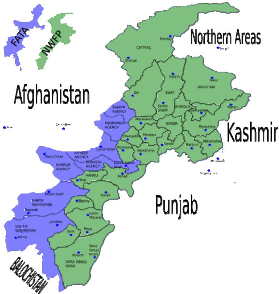
Carte de la NWFP et des FATA