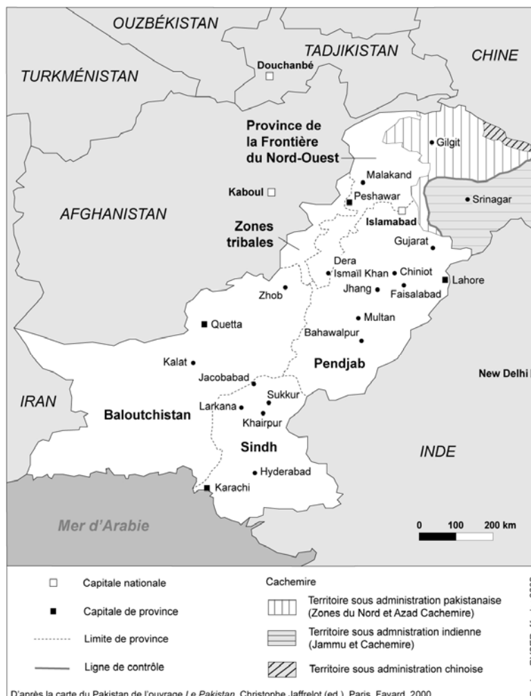
Carte générale du Pakistan

Cet article vise précisément à analyser l'origine de ce désordre qui résulte aussi bien de la montée en puissance des « Talibans pakistanais » que du retour des vieux démons que sont le sectarisme, les séparatismes et les violences urbaines. Il cherche enfin à esquisser des pistes qui pourraient permettre de renforcer un Etat pakistanais résiduel mais pas nécessairement condamné à l'impuissance.