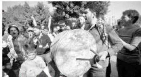
Des Syriens résidant en Égypte ont manifesté hier devant le siège de la Ligue arabe, au Caire.