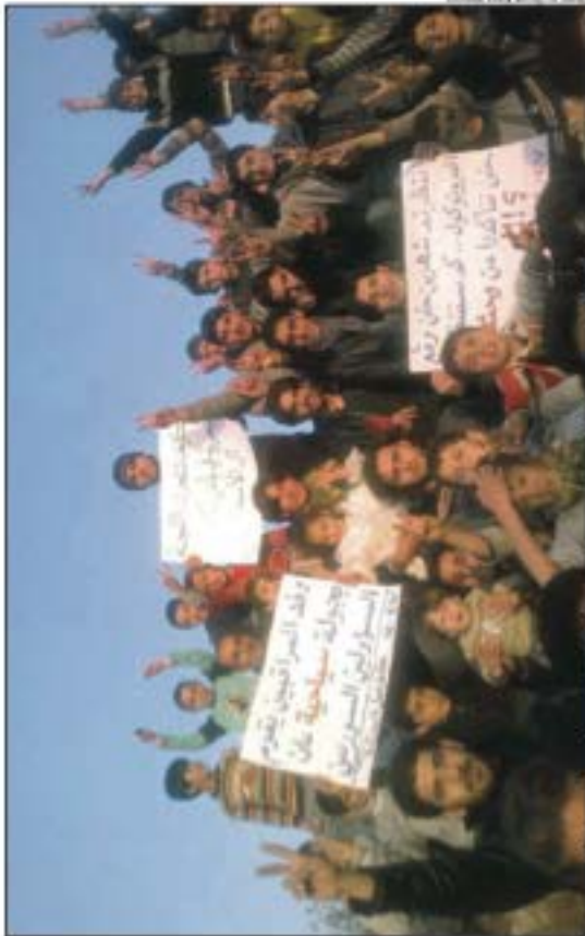
Protesters hold up placards according Arab League observers of embarking on tour in Homs in Syria.

resident-ified at one monitor to repeat what he had just told his headquarters. "You were beating the head of the mission that you cannot cross to the second street because of the gunfire. Why don't you say it to us?" the man shouted, grabbing the unidentifiable monitor by his jacket.