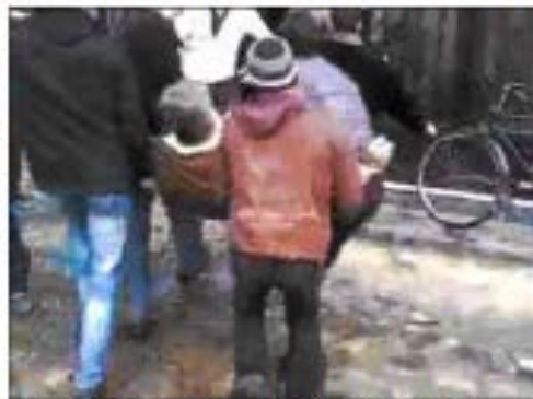
Varios hombres trasladan a un herido en la ciudad siria de Homs. 1218

La misma agencia aseguró que las tropas leales a Damasco se habían enfrentado a sirios en la frontera con Turquía con un grupo armado que intentaba cruzar desde el sector país, y varios de sus integrantes habían resultado muertos o heridos.