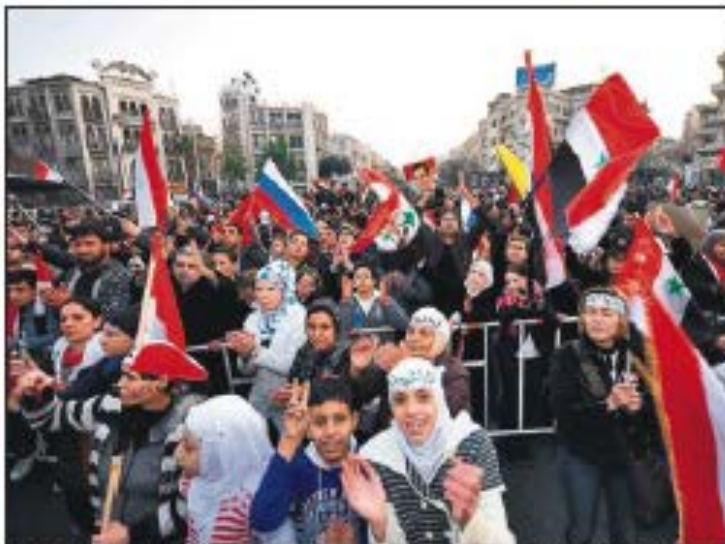
Avanza, los manifestantes de Homs se manifiestan este domingo para derrocar los atentados del régimen sirio. Abajo, una imagen de soldados sirios ocultos en un edificio de la ciudad sitiada en Homs. (1/11/11)

Como es habitual, la oposición es confusa porque no hay periodistas independientes en el país y dependen de los medios y las imágenes proporcionadas por la oposición a El Asad y de la versión, completamente distinta, ofrecida por medios oficiales como la televisión y la agencia estatal Sana. En una de las imágenes se ve a un hombre que grita a un observador que