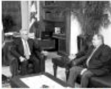
Le président du République en compagnie de membres du Conseil central de sécurité.

« L'État libanais a une responsabilité de sécurité et de défense, et il doit être en mesure de protéger ses citoyens », a déclaré le ministre de la Défense Fayez Choueiri.