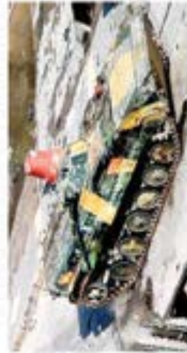
A Syrian tank is seen in this video grab driving through the city of Homs on Boxing Day

After arriving over the weekend, the team headed straight for Homs, where 34 people were killed by the security forces on Monday alone, according to activists, largely in Baba Amir. Videos purporting to be from the city have painted a grim picture of the price the city of just over 800,000 people has