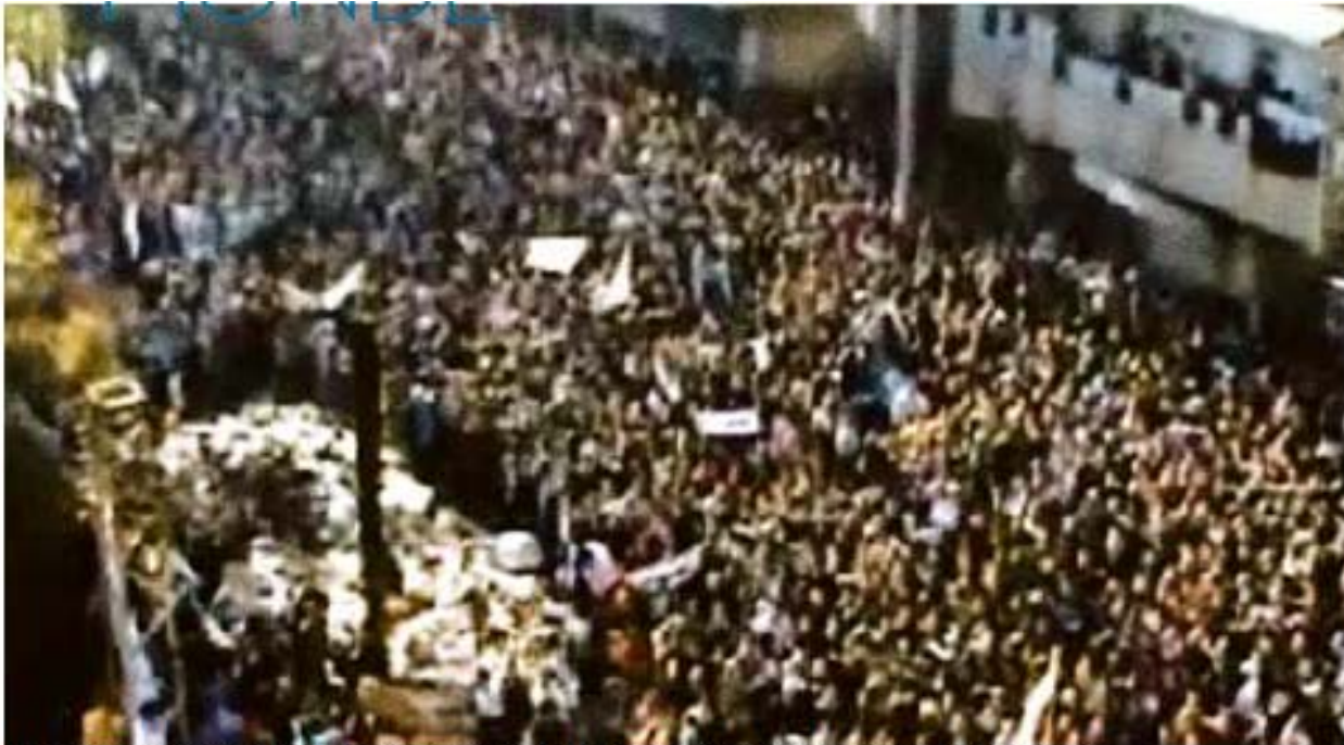
Hier dans le centre de Homs, des dizaines de milliers de personnes sont massées, notamment pour réclamer une protection internationale.