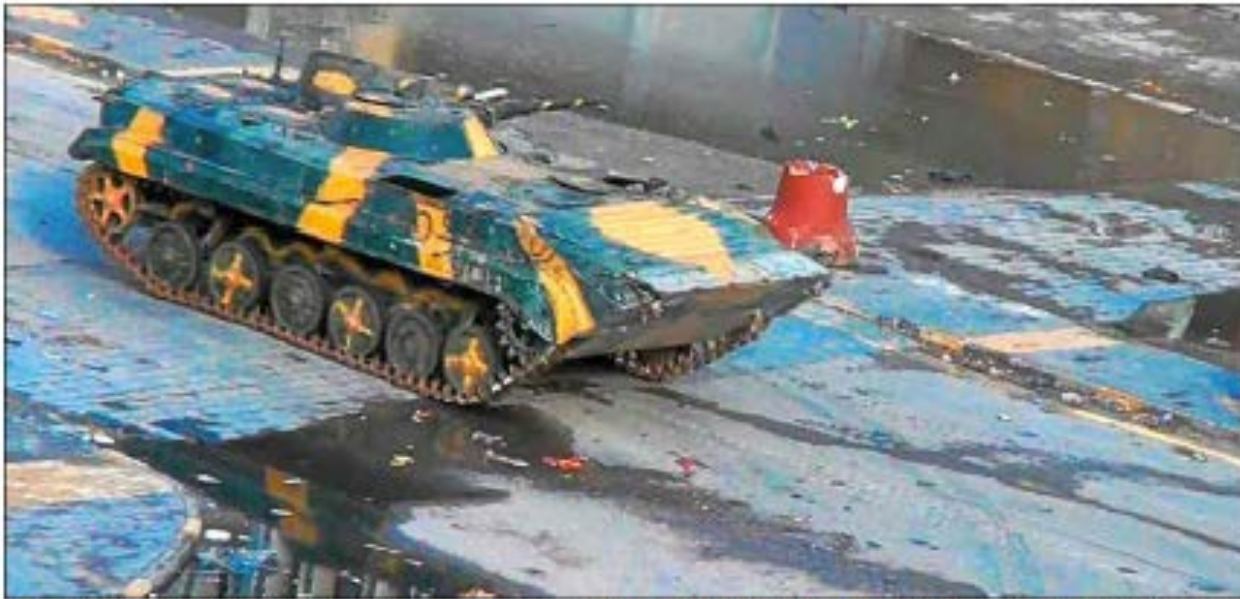
Captura de un vídeo en el que se ve un tanque sirio avanzando por la ciudad de Homs el pasado día 26 de diciembre, cuando decenas de personas fueron asesinadas según la oposición. 1217