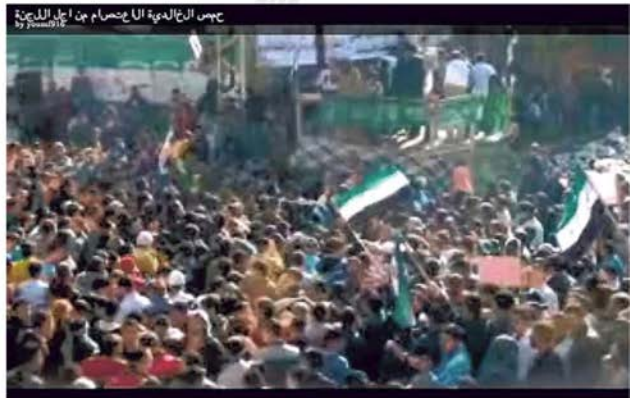
■ Activisten melden dat zeventigduizend tegenstanders van president Assad de straat opgingen in de stad Homs. Ook in andere Syrische steden vonden grote demonstraties plaats.