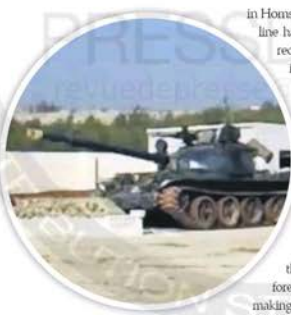
Syrian soldiers stand near a tank in Homs.

Assad is internationally isolated. Western powers and his neighbors Tur-