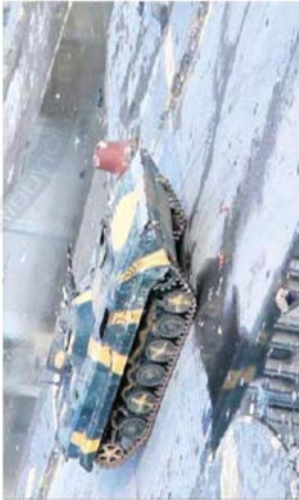
Capture vidéo montrant un char dans une rue de Homs, lundi.

« Au moment où les observateurs arrivaient à Babu Anwar, de nombreuses personnes se sont rassemblées affrontant tout le monde face au complet armé contre la