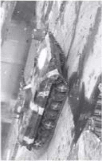
A video grab shows a Syrian tank driving through the city of Hama on Sunday.

The activists said Syria had failed to honor the three core conditions of the Arab League—freeing of political