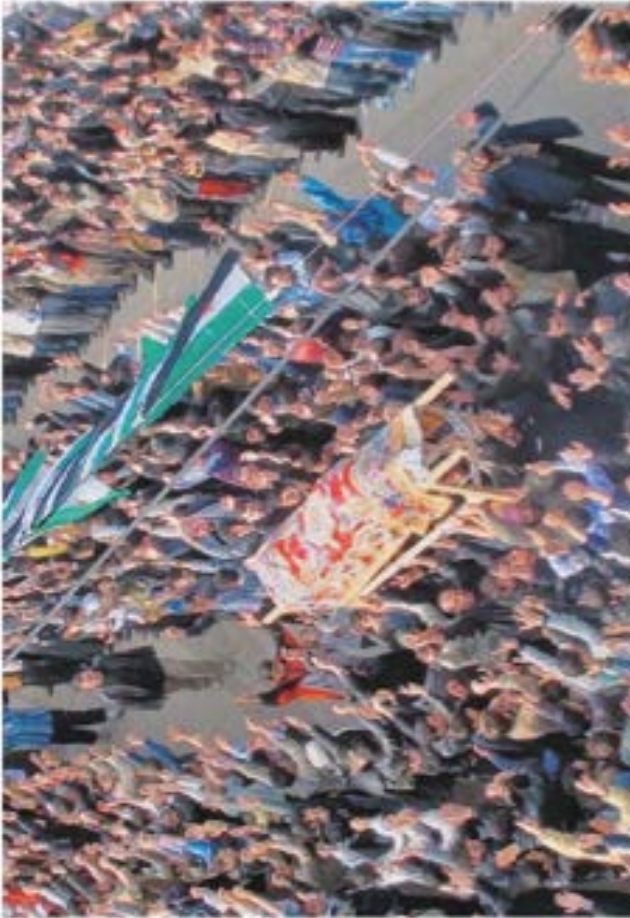
Esta imagem de dia 23 mostra o funeral de uma vítima dos protestos, perto de Homs

Para reprimir a insurreição em Homs, o regime do Presidente Bashar al-Assad usou carros de combate e atiradores furtivos. Em céus de alguns segredos, filmados por telemóveis no bairro do Bab al-Amr, podem ver-se ataques a casas, fortes tiroteios e bombardeamentos em ainda vítimas grave-