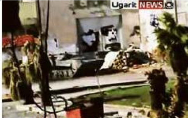
Des chars ont été saqueés, quittant la ville de Homs.