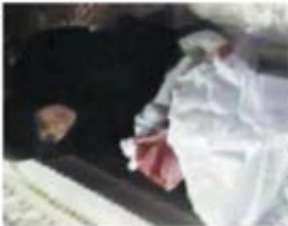
FOTO CIANDESTINA Una donna piange sul corpo di un paziente ucciso a Homs. Aq

chi a colpi di artiglieria pesante due gar- rite e almeno 15 civili uccisi nel tentativo (fittizio) di occultare le proteste. Ad attendere la delegazione c'erano infatti due cortei pacifici, almeno settantamila persone. Civili. Qualche militare dell'esercito libero siriano (Lbs) si è aggregato con l'intento di raggiungere la Piazza dell'Oslo e farsi scolare dagli osservatori. Ma il regime, sin dalla vigilia, aveva suggerito di dividersi in cinque gruppi. Il primo di 150 persone, il secondo di 150, il terzo di 150, il quarto di 150, il quinto di 150. Solo in 20 hanno rispettato il regime. Solo in 20 hanno rispettato il regime. Solo in 20 hanno rispettato il regime. Solo in 20 hanno rispettato il regime.