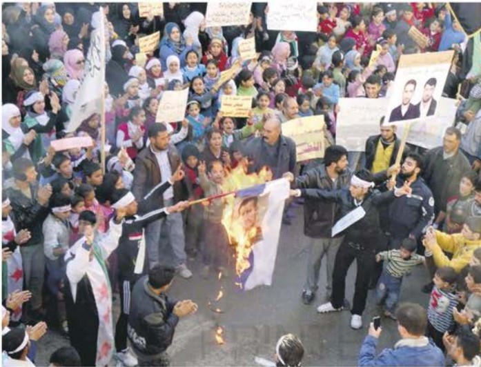
Demonstrators burn an image of Syrian President Assad during a demonstration in Baba Amro in Homs, in this Dec. 16 file photo.

The observers want to determine if Assad is keeping his promise to implement a peace plan to end his uncompromising crackdown on nine months of revolt that has generated an armed uprising, edging the country towards civil war