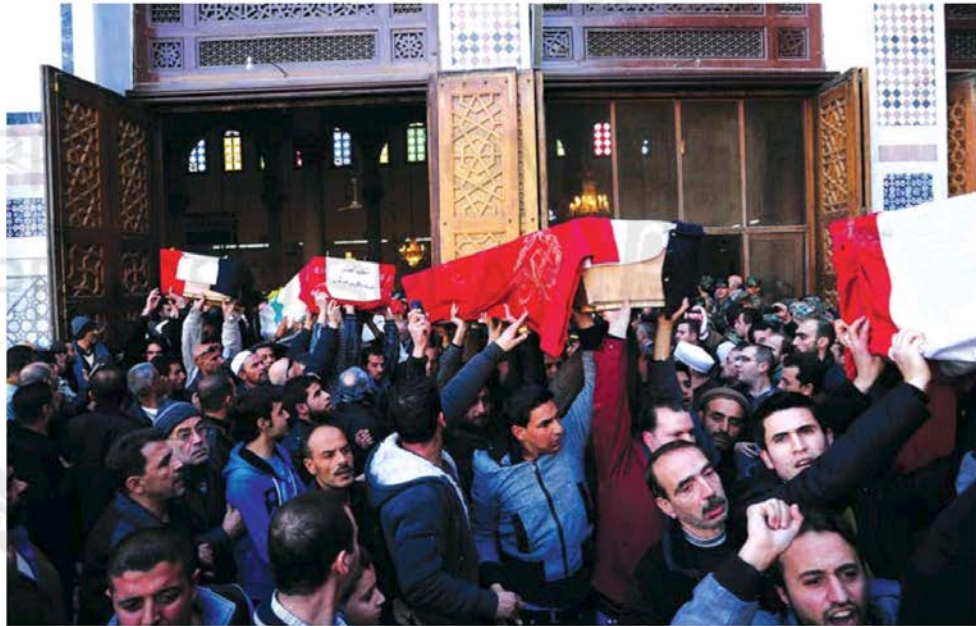
MOURNERS CARRY the coffins of people killed by two car bombs last week in Damascus. More violence is sure to rock Syria if the Assad regime survives the current insurrection.

Force is the only way to dislodge a violent regime. The recent agreement between the Arab League and the Assad regime to position 150 observers around the country to monitor events, when videos taken by courageous protestors speak for themselves, is merely an attempt to distract our attention from regime change.