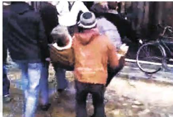
Amateurvideobeelden moeten bewijzen dat er in Homs opnieuw doden zijn gevallen.