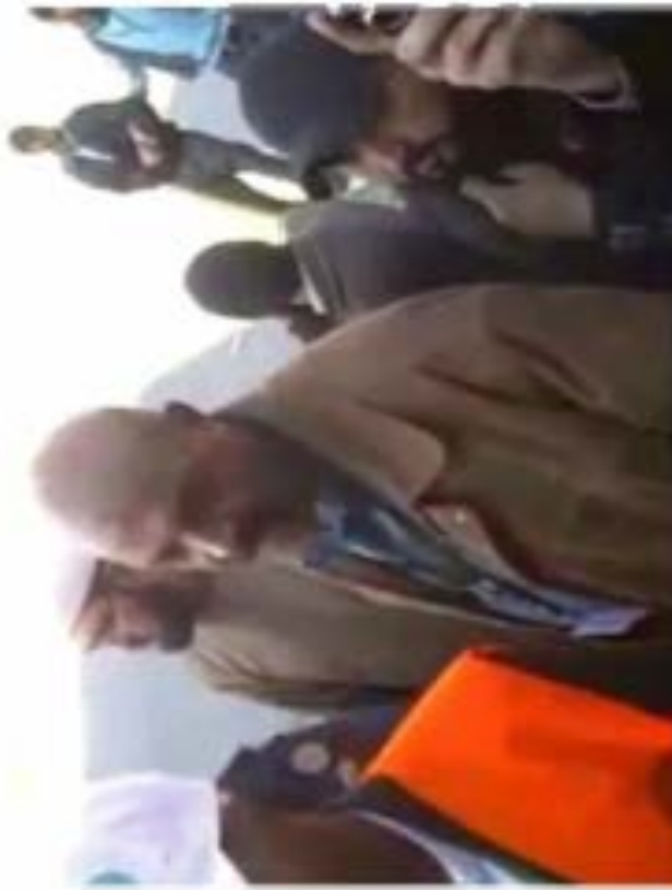
HOMS (SYRIE), HIER. Ce document, tiré d'une vidéo diffusée sur YouTube, montre les observateurs de la Ligue arabe pris à partie par des habitants qui veulent leur montrer ce qui se passe dans leur quartier.

ont dispersées avec des jets de gaz lacrymogène. Ils auraient également été à balles réelles dans une rue menant à la place, faisant au moins quatre blessés.