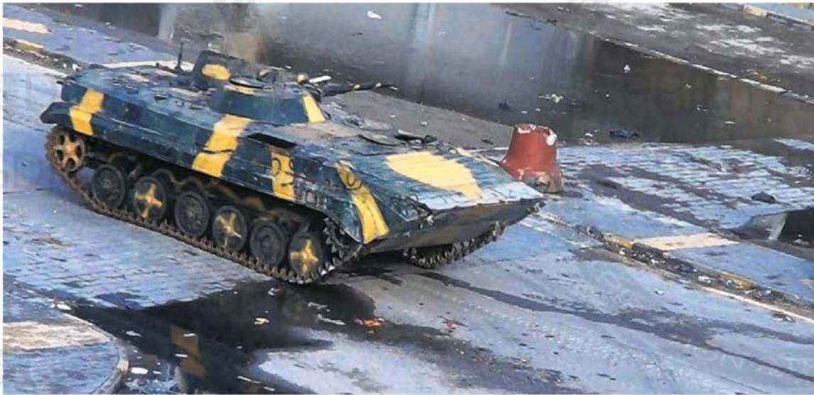
Een Syrische legertank in de straten van Homs. Verlaat hij de opstandige stad of niet, en zo ja, voor hoelang?