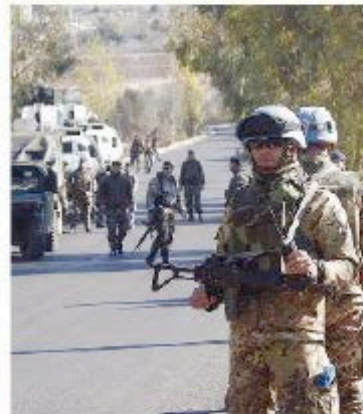
Caschi blu Soldati italiani pattugliano un'area a rischio missili nel Sud del Libano

I militari giudicano adeguate le regole d'ingaggio attuali per garantire la sicurezza dei caschi blu, però non nascondono che si tratta di una missione prestigiosa, ma anche molto delicata.