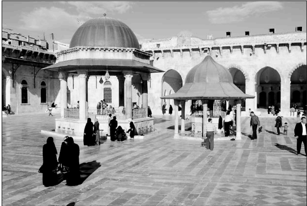
Umayyad mosque in Aleppo, a city where protests have been limited so far but where the continuing violence is hurting the economy