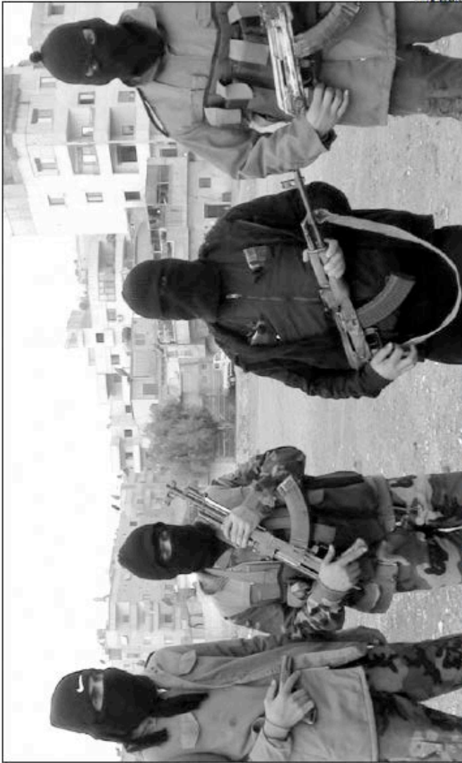
Syrian soldiers who defected to join the Free Syrian Army pose in Duma, near Damascus.

As the fighters entered the newly renamed Martyrs Square, accompanying a small group of foreign journalists, they were warmly welcomed by people who carried them on their shoulders and waved the green, white and black flag which dates to before Assad's Baath Party seized power nearly 50 years ago.