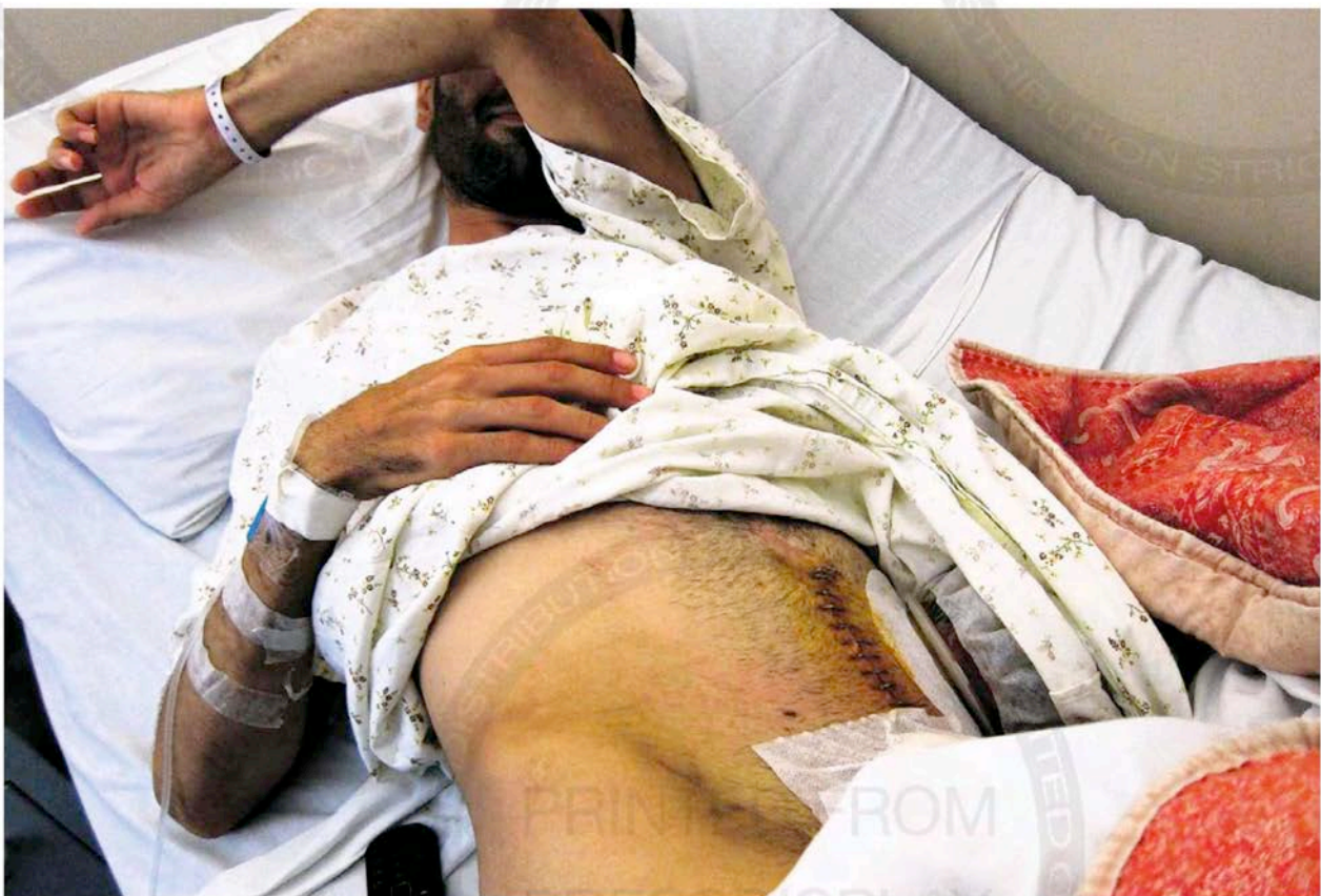
Een gewonde Syrische opposant wordt behandeld in een ziekenhuis in het noorden van Libanon.

Terwijl de volksopstand in Syrië voortwoedt, vinden gewonden een wankel toevlucht in buurland Libanon. Ze worden illegaal over de grens gesmokkeld. 'Voor ons geen normaal leven zolang we het regime niet ten val brengen.'