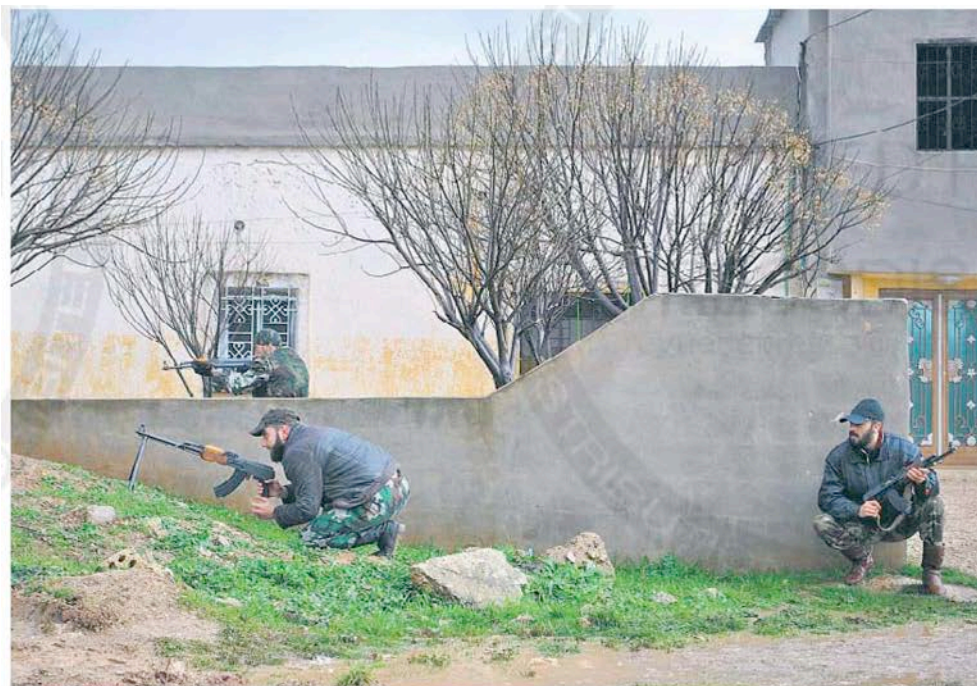
Desertierte syrische Soldaten sichern eine Strasse in einem Ort in der Provinz Homs.