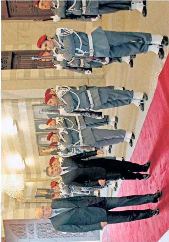
The Lebanese prime minister Najib Mikati, left, said the historical and geographical ties between Lebanon and Syria has been a factor in forming a policy that is in the "interest of Lebanon".

The opposition March 14-bloc has voiced support for the uprising and last week welcomed a statement issued by the main political opposition group, the Syrian National Council, that called for a "new page" in Lebanon-Syria relations. Mr Mikati would not be drawn on the comments, but said that this policy of "disassociation" is the only way to preserve the period of relative stability that Lebanon is witnessing. "What concerns me in Syria today, the most important [thing] is stopping this kind of bloodshed," he said. "That is the most important for me. Every day we are hearing killing from both parties. This should stop."