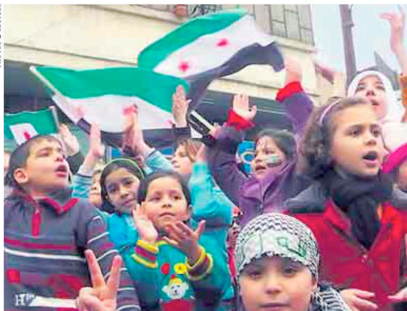
Children chant slogans as Syrian independence flags are waved behind them during a protest against Syrian President Bashar al-Assad in Khalidiyah, near Homs.