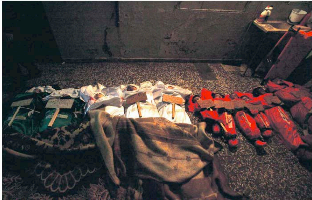
Les corps de onze habitants du quartier de Nashine à Homs, jeudi 26 janvier, après un assaut attribué aux forces de sécurité syrienne.

Selon l'agence de presse officielle syrienne SANA, 21 militaires, civils et membres des forces de sécurité ont été enterrés, jeudi 26 janvier, après avoir été tués par des «groupes terroristes armés». SANA a fait par ailleurs état de