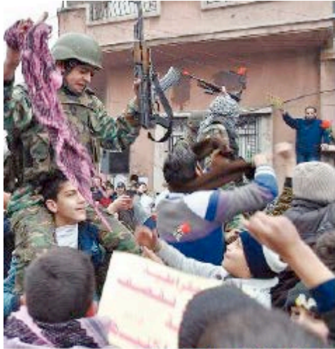
Disertori portati in trionfo

Centinaia di soldati hanno lasciato le forze regolari per riunirsi nell'Esercito libero della Siria, fondato in luglio dal colonnello dell'aviazione Riad al-Asad