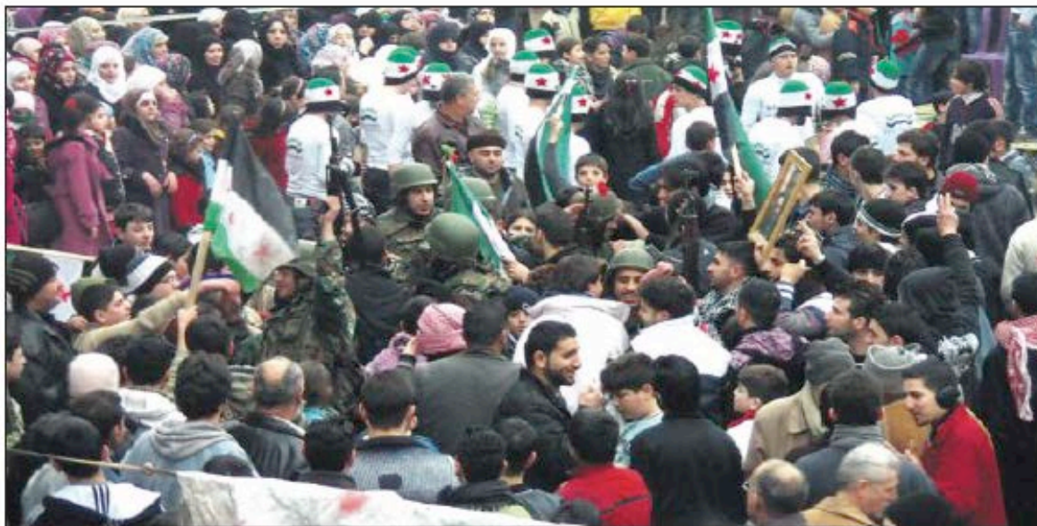
Soldados sirios que se han unido al Ejército de la liberación junto a los manifestantes contra el régimen de Bashar al Asad en Khalidieh, cerca de Homs.