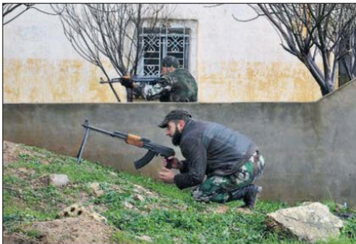
Desertores del Ejército sirio defienden una calle próxima a una manifestación antigubernamental en Homs.

Rusia dio indicaciones de que podría vetar esa resolución, ya que como miembro permanente de ese Consejo goza de esa potestad. El viceministro de Asuntos Exteriores ruso, Gennady Gatilov, dijo en una entrevista a la agencia Interfax que "cualquier decisión sobre el futuro político en Siria debe tomarse sin condiciones previas" y que la exigencia de que El Asad dimita constituye "una condición previa". "No podemos dar nuestro apoyo a la salida de El Asad en una resolución del Consejo de Seguridad", añadió.