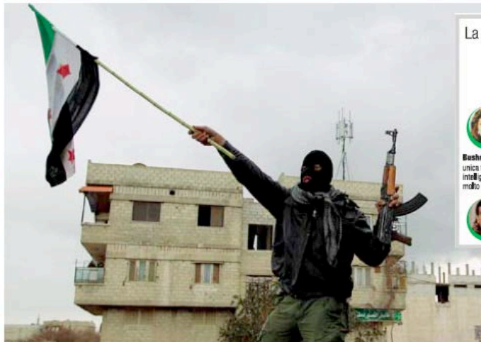
Disertore Un soldato siriano che si è unito ai ribelli venerdì scorso a Saqba, nei dintorni di Damasco

QARDAHA — Il mausoleo ottagonale domina il centro del villaggio come un tragico memento di morte e allo stesso tempo di nostalgia per un passato più felice. Il marmo bianco e nero è tirato a lucido ogni giorno da un ampio stuolo di guardiani. Le cupole bombate ricordano quelle delle moschee iraniane. Al centro sta la tomba di Hafez Al Assad, il padre della patria, il patriarca della Siria contemporanea, il fine politico celebre per la sua capacità di trasformare la debolezza in forza, tanto da imporre dal 1970 sulla maggioranza sunnita (oltre il 70% dei siriani) il governo della minoranza alawita che non supera il 12% della po-