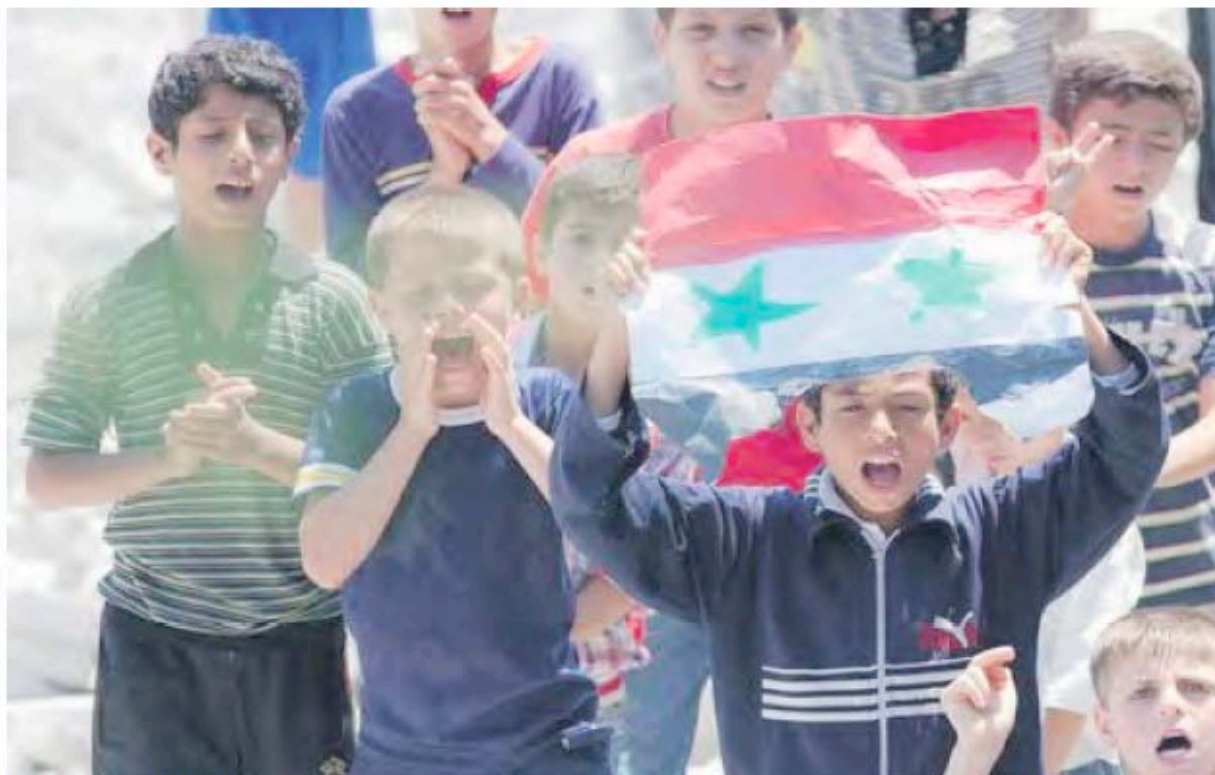
Bambini sventolano la bandiera siriana