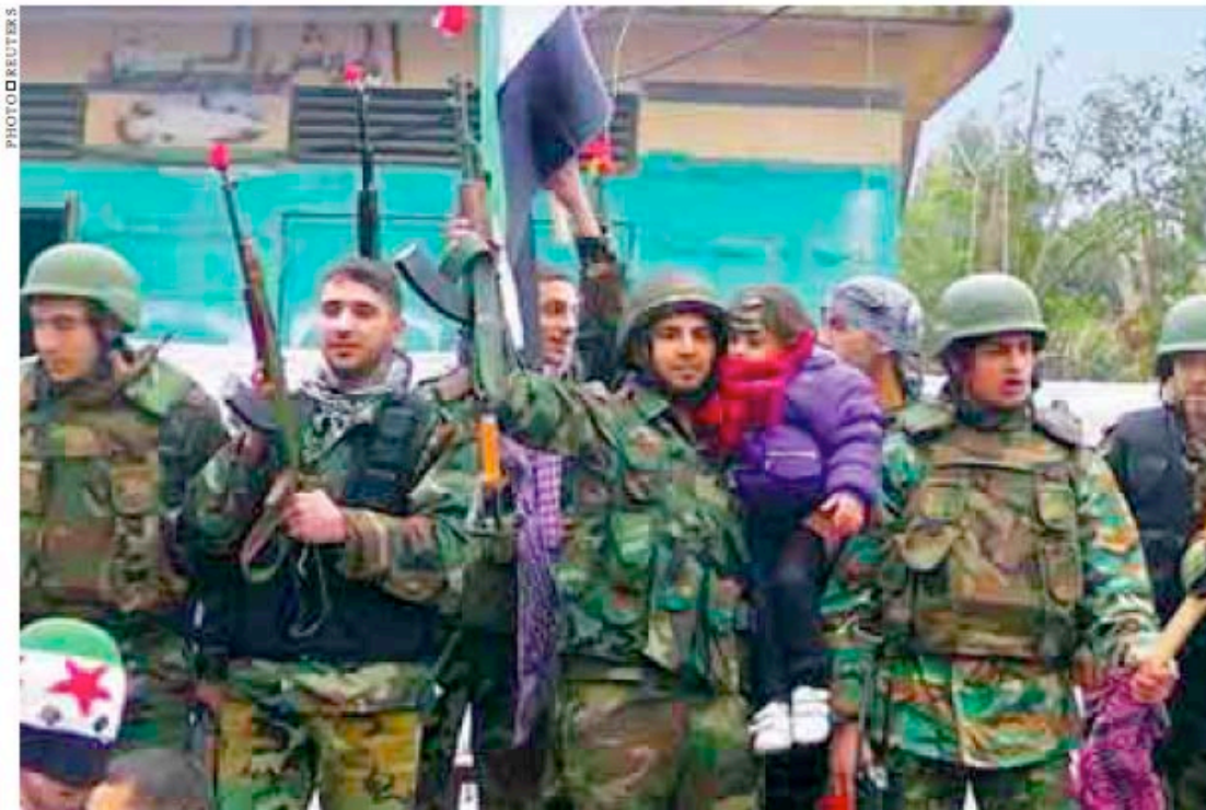
Syrian soldiers who have defected to the Free Syrian Army hold up their rifles decorated with roses and wave Syrian independence flags during a protest in Khalidieh.

VIDEO POSTED ONLINE BY ACTIVISTS SHOWED THE BODIES OF FIVE SMALL CHILDREN, FIVE WOMEN OF VARYING AGES AND A MAN, ALL BLOODED AND PILED ON BEDS IN WHAT APPEARED TO BE AN APARTMENT AFTER A BUILDING WAS HIT IN THE KARM EL-ZAYTOUN NEIGHBORHOOD OF THE CITY