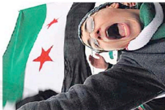
Protesto anti-Assad na Jordânia

No conflito morreram pelo menos 5700 pessoas, 384 delas crianças, de acordo com os dados divulgados ontem por Marixir Mercado, porta-voz da Unicef, a agência da ONU para a infância. Mercado disse que o número se baseia em relatórios das organizações de direitos humanos e que a maior parte das crianças mortas são rapazes. "Perto de 380 crianças estão detidas, algumas com menos de 14 anos", acrescentou.