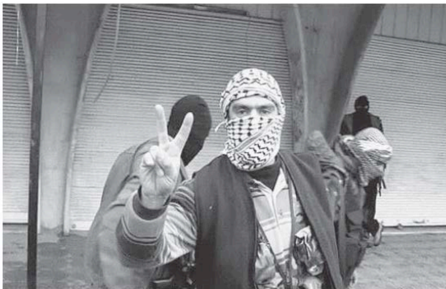
Siegesgewiss: Aufständischer in der belagerten Stadt Sabadani

SYRIEN Die arabische Beobachtermission geht vorerst zu Ende, die Gewalt nicht. Beschuss der aufständischen Stadt Sabadani dauert trotz Ankündigung eines Waffenstillstands an