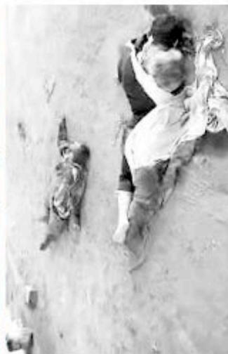
Les violences inédites aux abords de Damas ont fait de nombreuses victimes.