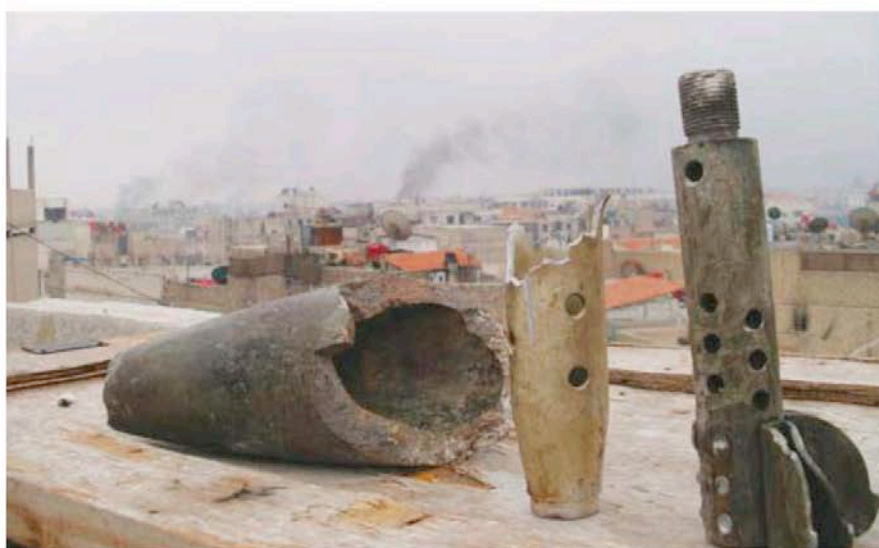
SMOKE RISES from Erbeen near Damascus yesterday after Syrian troops launched an assault to recapture it from rebels.

The Arab League suspended the work of its monitors on Saturday after calling on