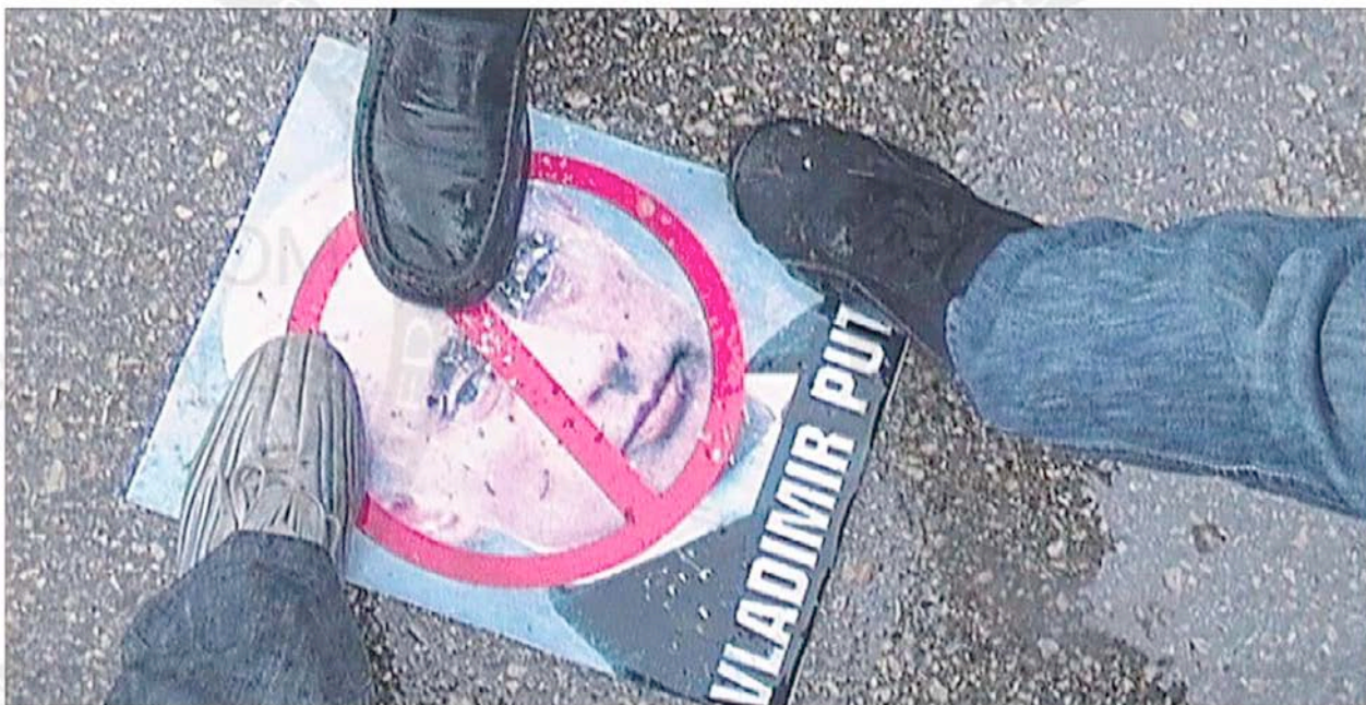
People stepping on Prime Minister Vladimir Putin's poster during a protest against Syrian President Bashar Assad after Friday prayers in Homs, Syria.