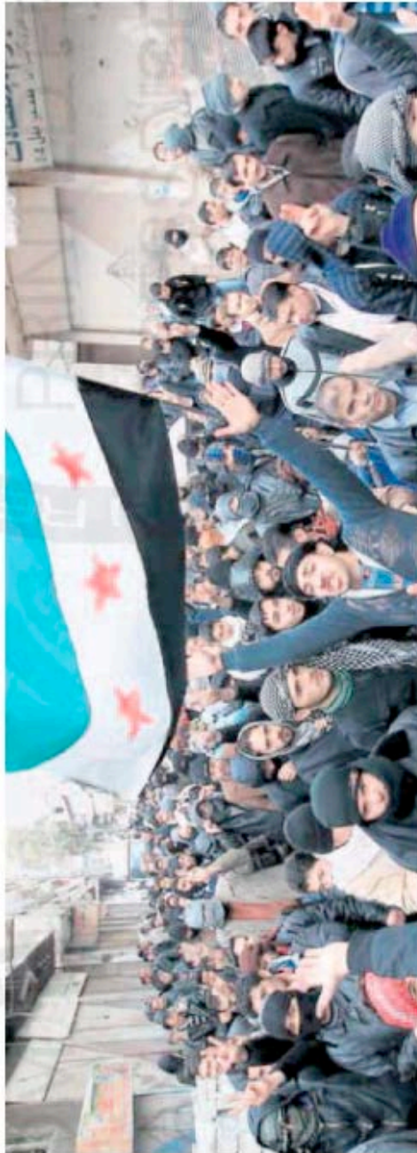
Aufstand. Syrer gehen in einem Vorort von Damaskus gegen das Regime von Präsident Baschar al Assad auf die Straße.

Morocco hatte an diesem Tag einen neuen Resolutionenentwurf kursieren lassen, der zwischen den arabischen und europäischen Staaten abgestimmt ist. Noch am Freitag legten die europäischen und