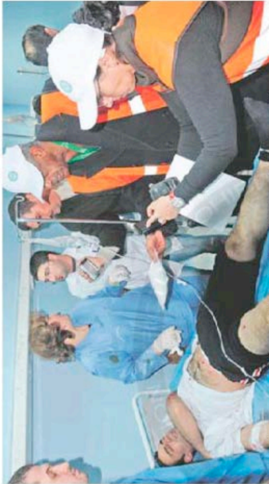
La mission des observateurs de la Ligue arabe, ici auprès d'un blessé début janvier à Damas, a été suspendue samedi.

Face aux déserteurs de l'ASL, et à tous les hommes en armes qui s'en réclament désormais, le pouvoir n'a eu d'autre