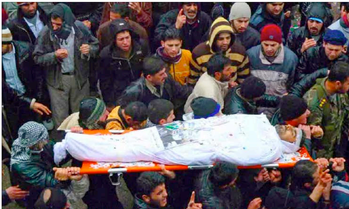
Opositores sirios trasladan el cadáver de un joven fallecido durante los enfrentamientos en Baba Amro, cerca de la ciudad de Homs.