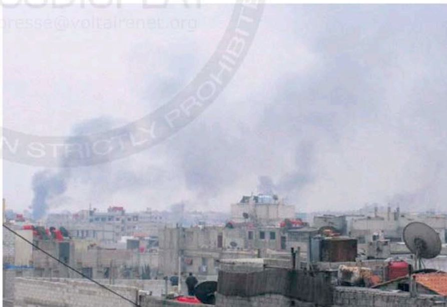
De la fumée s'élevait hier au-dessus d'Erbeen, dans la banlieue de Damas.

Car l'état se resserre autour du régime, note Jean-René Belliard. Parfois de manière spectaculaire.