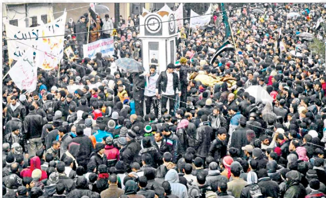
Anti-government protesters carry the coffins of victims of clashes in Baba Amro, near Homs. Violence has escalated after the suspension of the Arab League mission