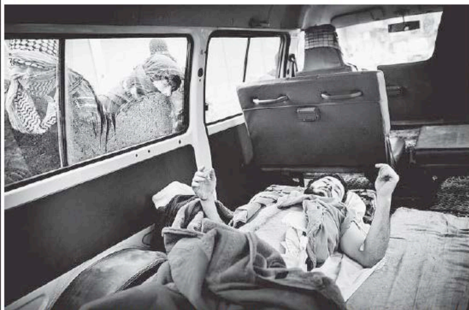
Kontrollpunkt in Saqba, einem Vorort von Damaskus: verletzter Rebell in einem Transporter nach heftigen Kämpfen am Freitag