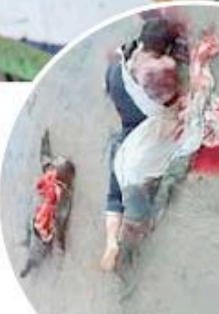
Terrore per le strade Alcuni cadaveri di «ribelli» abbandonati ferri in una strada alla periferia di Damasco dopo uno scontro

Ieri in attesa presto, viaggiando da centro della capitale verso l'aeroporto internazionale