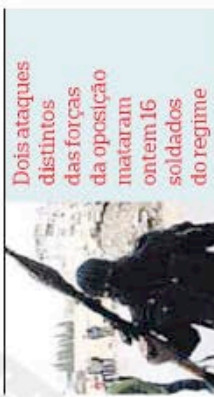
Dois ataques distintos das forças da oposição mataram ontem 16 soldados do regime

bertação e uma série de milícias que actuam por conta própria têm vindo a intensificar-se em todo o país.