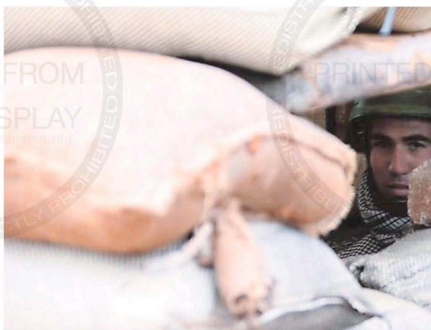
Un militar se protege entre sacos terreros en la ciudad de Dara, donde empezó la revolución

Como en Túnez, Egipto y Libia, el control de la capital del país es básico para el triunfo de las aspiraciones opositoras. El régimen es consciente y por eso trata de blindar Damasco en una semana crucial en la que la Liga Árabe y la Unión Europea presentarán un plan conjunto ante el Consejo de Seguridad de Naciones Unidas. El plan tiene como primer punto la dimisión del presidente Bashar al-Assad y la formación de un gobierno de unidad nacional, algo a lo que Rusia y China se han opuesto de forma tajante ya que piden una oportunidad para el plan de reformas propuesto por el presidente.