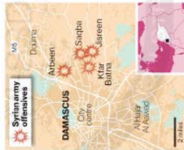
"Syria's regime is trying to end the uprising militarily now that the case is being taken to the United Nations"

In suspending the mission, he said that the government had "resorted to escalating the military option in complete violation of [its] commitments" to stop the bloodshed and to withdraw its troops from Syria's urban areas.