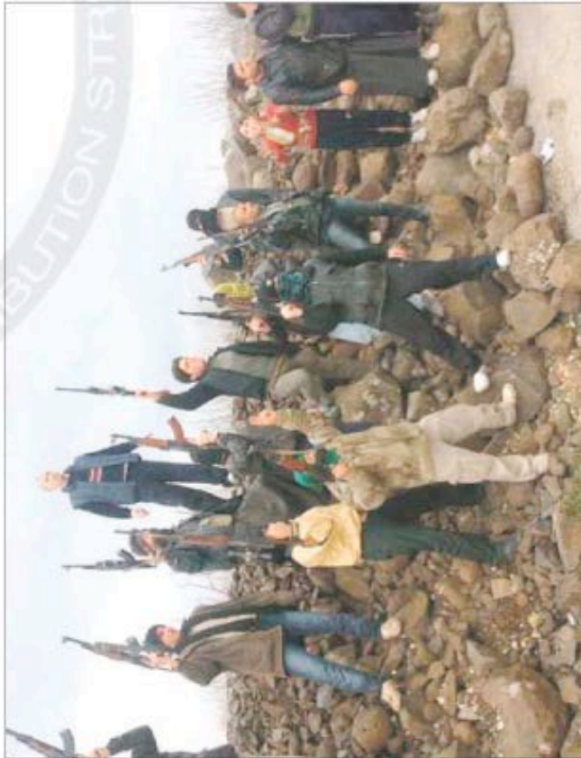
Syrian soldiers who defected to join the Free Syrian Army join demonstrators protesting President Bashar al-Assad in the northern province of Idlib. Assad still holds the loyalties of the officer corps.

Prices are soaring, fuel is scarce, and lines form at gas stations as sanctions imposed by the United States and the European Union take their toll on the