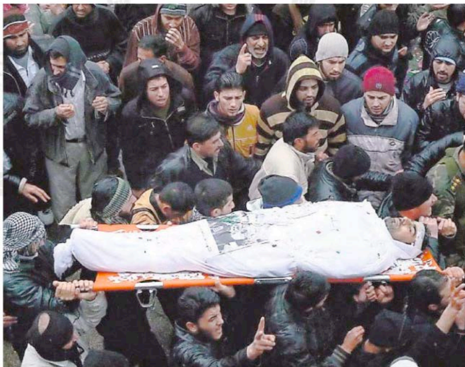
En la imagen, funeral de un opositor en un suburbio de Damasco

¿Es el inicio de la batalla por Damasco?, les preguntamos. «Son días clave, los seguidores del régimen tienen dudas y ya no muestran su apoyo de la forma tan efusiva que lo hacían antes, saben que las informaciones sobre excesos de las fuerzas de seguridad son ciertas y empiezan a ver cómo sus vecinos perdemos el miedo a hablar y pedir libertad», señala una joven activista de Harasta, otro bastión opositor de la periferia, que pien-