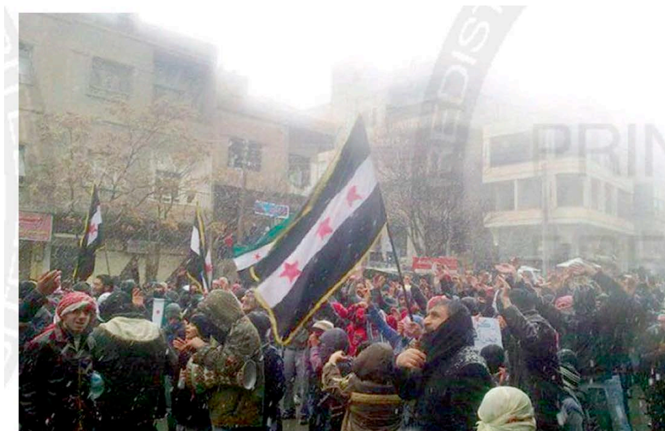
Anti-government Syrian protesters holding an independence flag during a demonstration in the town of Yabrud.