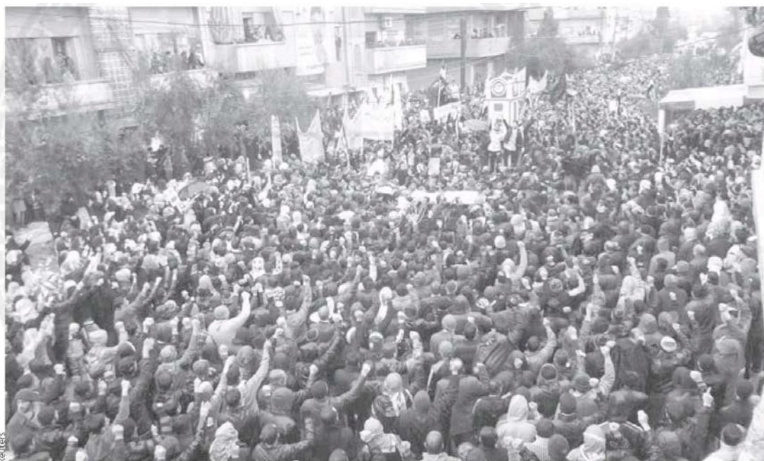
Antigovernment protesters carry coffins during a funeral for protesters killed in earlier clashes in Baba Amro, near Homs.