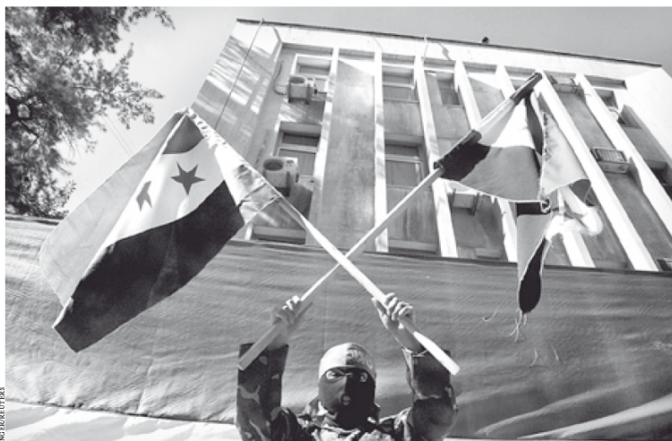
»Nein« zu Verhandlungen mit Assad: Protest vor der russischen Botschaft in Beirut am Sonntag

Die heftige Kritik vor allem in NATO-Mitgliedsländern an dem Veto nannte Lawrow »hysterisch«. Die Kommentare hätten zum Ziel, das Wesentliche in Syrien »zu vertuschen«: »Das Wesentliche besteht eben darin, daß es in Syrien mehr als nur eine Quelle von Gewalt gibt«. Rußlands Außenminister kritisierte zudem, daß mit Hilfe der Reformbewegung in Syrien versucht wird, Assad zu stürzen. »Wir sehen, daß der Friedensbewegung sich auch diejenigen anschließen versuchen, die sich ganz andere Ziele gesetzt haben«, sagte Lawrow laut RIA Nowosti . Dafür würden Extremisten mit Waffen versorgt und die Opposition aufgerufen, keinen Dialog mit der Staatsführung anzufangen, so Lawrow. Auch den Oppositionsvertretern im Ausland werde »nachdrücklich empfohlen«, keinen Kompromiß und keinen Dialog mit dem Regime von Präsident Assad einzugehen. Die