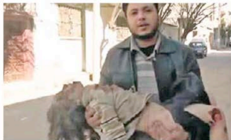
Un homme évacue un enfant blessé, lundi, à Homs.

AU MOINS 69 personnes, en majorité des civils, ont été tuées hier en Syrie. À Homs, haut lieu de la contestation, au moins 42 civils sont morts et des dizaines ont été blessés au cours d'un bombardement d'une violence inédite, selon l'Observatoire syrien des droits de l'homme (OSDH), basé à Londres. À Zabadani, des centaines de blindés ont pris d'assaut cette ville rebelle au nord-ouest de Damas, « parallèlement à des tirs nourris et des bombardements de chars », toujours selon l'OSDH.