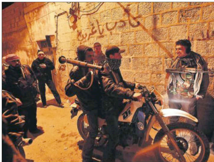
Rebeldes sirios armados se refugian en un callejón durante una manifestación el domingo en Idlib.

El grave deterioro de la situación humanitaria, con más de 6.000 víctimas mortales hasta la fecha, y el bloqueo por parte de Rusia y China en el Consejo de Seguridad de la ONU, obligan, sin embargo, a EE UU a tomar más decididamente la iniciativa para no dar una imagen de pasividad ante lo que puede acabar siendo una prueba sobre la capacidad de liderazgo internacional de Obama. Después de todo lo que han dicho los miembros de esta Admi-