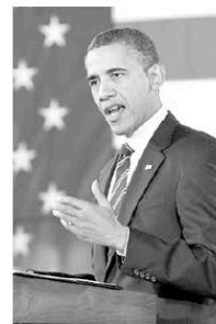
Barack Obama s'est engagé à rester ferme hier dans l'application des sanctions infligées à la Syrie.