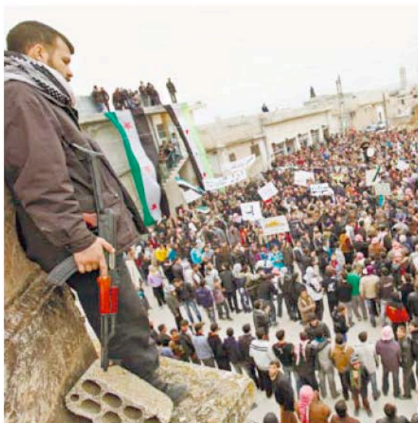
A member of the Free Syrian Army at a protest in Idlib yesterday.

Israel has been warning for several years that Syria may provide Hezbollah with advanced weapons systems. The foreign media reported that Hezbollah has main-