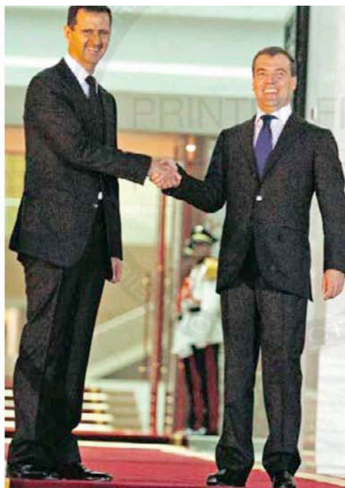
Bachar el-Assad et Dmitri Medvedev, en mai 2010, à Damas.

La Russie est soupçonnée d'avoir récemment livré des batteries antiaériennes à Damas, qui redoute des bombardements de l'Otan. Moscou a également conclu un accord de 550 millions de dollars portant sur la livraison de 36 avions d'entraînement et d'attaque légers Yak-130, mais la première fourniture n'a pas encore eu lieu. La coopéra-