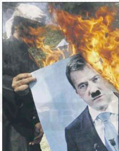
A Kuwaiti burns a picture of Russia's Dmitry Medvedev