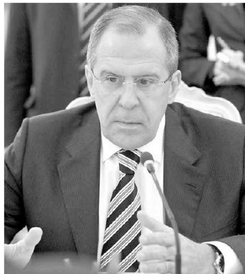
Le ministre russe des Affaires étrangères Sergueï Lavrov. Quel message va-t-il délivrer à Damas ?

Pour de nombreux analystes, le veto russe s'explique moins par un soutien indéfectible à M. Assad ou à l'espoir de voir la Syrie revenir à la situation d'avant mars 2011 qu'à la volonté de Vladimir Poutine, qui entend être réélu à la présidence en mars, de démontrer qu'il est prêt à s'opposer aux initiatives occidentales visant à produire des changements politiques dans des États souverains et à défendre les intérêts géostratégiques de son pays. « L'objectif extrême de la Russie est double : sauver ce qui peut être sauvé d'un naufrage du régime Assad et contenir l'influence occidentale sur son allié le plus important du monde arabe », estime Shashank Joshi, chercheur au Royal United Services Institute. Dans la situation présente, où M. Assad est soumis aux pressions conjuguées des capitales occidentales, de ses pairs arabes et de la contestation, la meilleure carte de la Russie pour préserver son influence pourrait être de rechercher « une transition contrôlée vers un nouveau régime dépouillé de M. Assad mais édifié autour des loyalistes de la dynastie Assad », ajoute-t-il. Mais Moscou joue serré. En