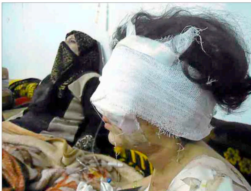
Una niña herida en los bombardeos de Bab Amro en la localidad siria de Homs.

Lavrov se quejó de que el proyecto de resolución de la ONU fue sometido a votación apresuradamente el 4 de febrero, a pesar de que Rusia pidió esperar unos días para volver a analizar la situación. Para Moscú y Pekín, la solución de la crisis siria debe pasar por el cese inmediato de la violencia y la imposición de reformas democráticas acordadas entre el Gobierno y los rebeldes. «No vemos ninguna