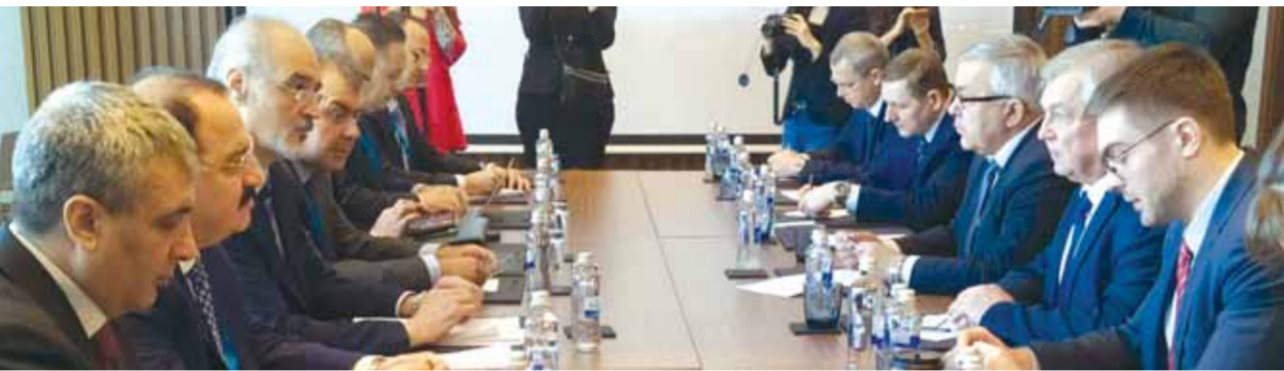
وفد الجمهورية العربية السورية إلى محادثات أستانا خلال لقائه الوفد الروسي

الخاص للأمن العام للأمم المتحدة إلى سورية غير بيدرسون الذي يشارك في الجولة الحالية بصفة مراقب. وفي تصريحات للصحفيين على هامش الجولة، اعتبر بيدرسون، أن البت في مسألة نقل جلسات اللجنة الدستورية إلى دمشق من عدمه، يعود لسوريين أنفسهم، ومن جانبه اعتبر لافرنيتيف أن هناك «شروطاً محددة ينبغي أن يتم تحقيقها لنقل اللجنة الدستورية من جنيف إلى دمشق»، وأضاف: «بذلنا جهوداً كبيرة لمساعدة المبعوث الخاص للأمم العام للأمم المتحدة في جنيف، ولذا نحن جاهزون للمساهمة في عقد أعمال اللجنة هناك».