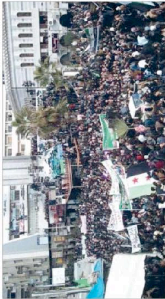
الجزان للتسجيل (المنشور)