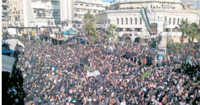
Outside Damascus, thousands mourned the deaths of 11 residents

President Bashar al-Assad blames the uprising that erupted in March on terrorists and armed gangs who are part of a foreign conspiracy to destabilise the country. Mr Assad's regime has retaliated with a brutal crackdown that the UN says has killed more than 5,400 people. But there is growing urgency to find a resolution to a crisis that is