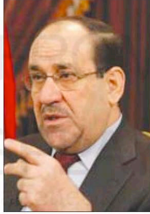
نوري المالكي (أب)

وأضاف المالكي «بفضل سياساتنا.. العراق لم ولن يتبع سياسات أي دولة أخرى».