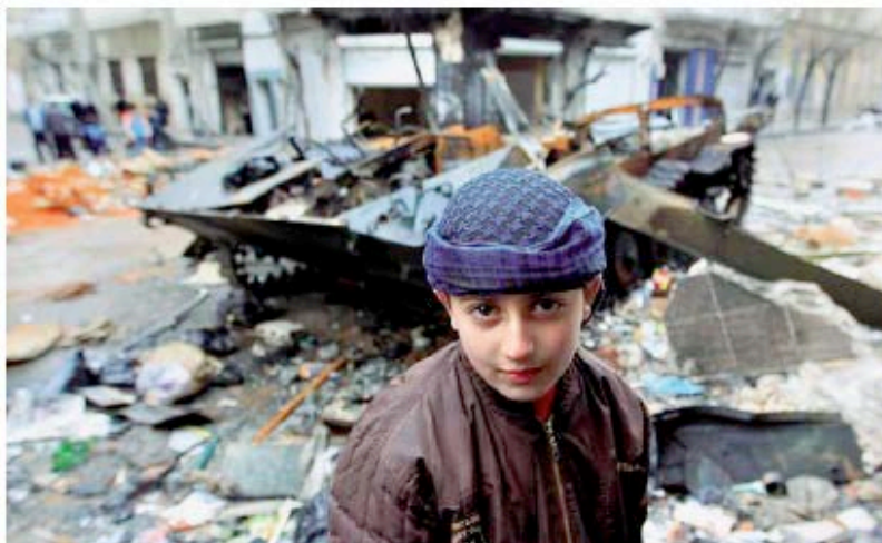
In prima linea Una ragazzina deraa a un tank a Homs. Le rivolte in Siria sono iniziate 10 mesi fa con l'arresto di un gruppo di giovani

HOMS — Se è vero che ogni rivoluzione ha un mito fondativo, quella siriana lo riassume nei «8 ragazzini di Deraa. Lo favoleggiava dovunque nelle piazze insanguinate del Paese lacero dalla violenza. Negli ultimi sei giorni ce lo hanno raccontato sempre gli attivisti delle sommosse nelle zone più calde. Ieri è accaduto a Homs. «Le prime mobilitazioni di massa qui sono cominciate tra febbraio e marzo dell'anno scorso, quando si venne a sapere che «8 alunni delle scuole superiori di Deraa, non lontano dal confine con la Giordania, erano stati arrestati dalle forze speciali del presidente Bashar Assad per aver scritto slogan sui muri inneggiando alla Primavera araba. La nostra rabbia è cresciuta allora col diffondersi delle notizie di torture, e soprattutto con le dichiarazioni offensive di Atef Najib, capo delle forze di sicurezza o cugino di Assad, il quale disse pubblicamente alle famiglie che dimostrarono i loro bambini. E anzi, se ne avessero voluti di nuovi, che portassero le mogli nelle caserme: ci avrebbero pensato i suoi uomini a ingravidare le donne», ricorda Hassan, uno studente incontrato presso la Piazza dell'Orologio, dove a metà aprile vennero massacrati centinaia di manifestanti. Qualcuno sospirava ieri fossero persino 500.