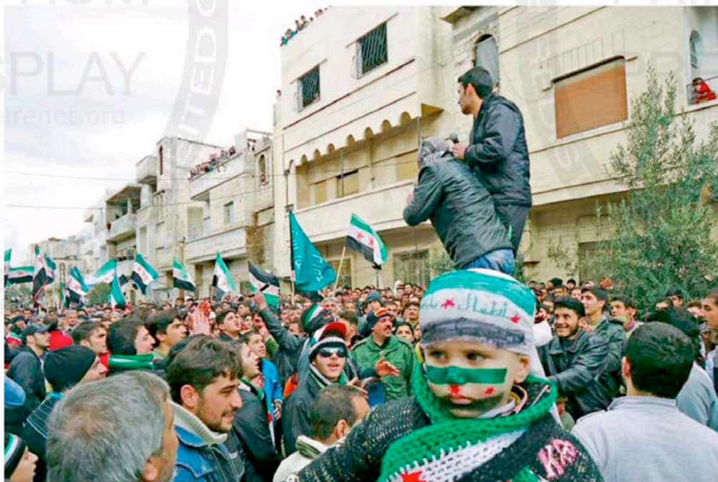
Demonstrators take part in a protest against President Bashar Al Assad in Baba Amro, near Homs.

"Syria rejects the decisions taken which are outside an Arab working plan, and considers them an attack on its national sovereignty and a flagrant interference in internal affairs," state TV quoted an official as