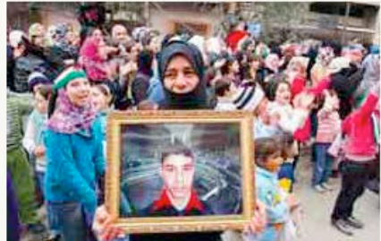
A Syrian protester holds a picture of a missing relative during a protest against Syrian President Bashar al-Assad in Baba Amr, near Homs, in this Jan. 22, 2012 file photo.