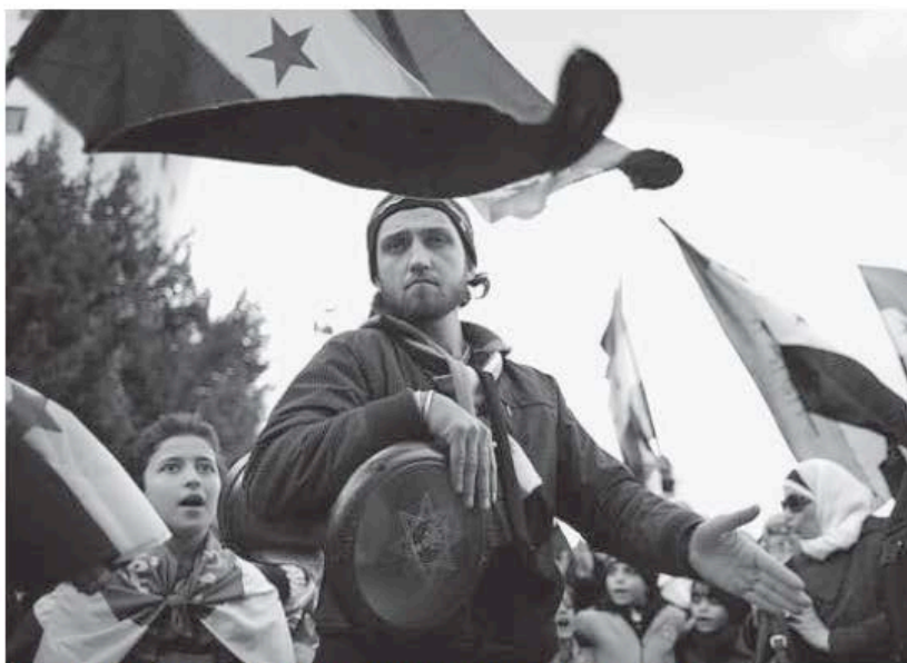
Syrische Oppositionelle protestieren vor dem Gebäude der Arabischen Liga in Kairo

Mit dem Beschluss von Sonntagabend hat die Arabische Liga den Ton gegenüber Assad verschärft. Doch der große Schwachpunkt ist die Durchsetzung der neuen Forderungen.