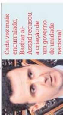
Cada vez mais encurralado, Bashar al-Assad recusou a criação de um governo de unidade nacional.

A preparação de eleições legislativas e presidenciais “plurais e livres, sob supervisão árabe e internacional”, seria outra tarefa do governo de unidade, segundo a AFP.