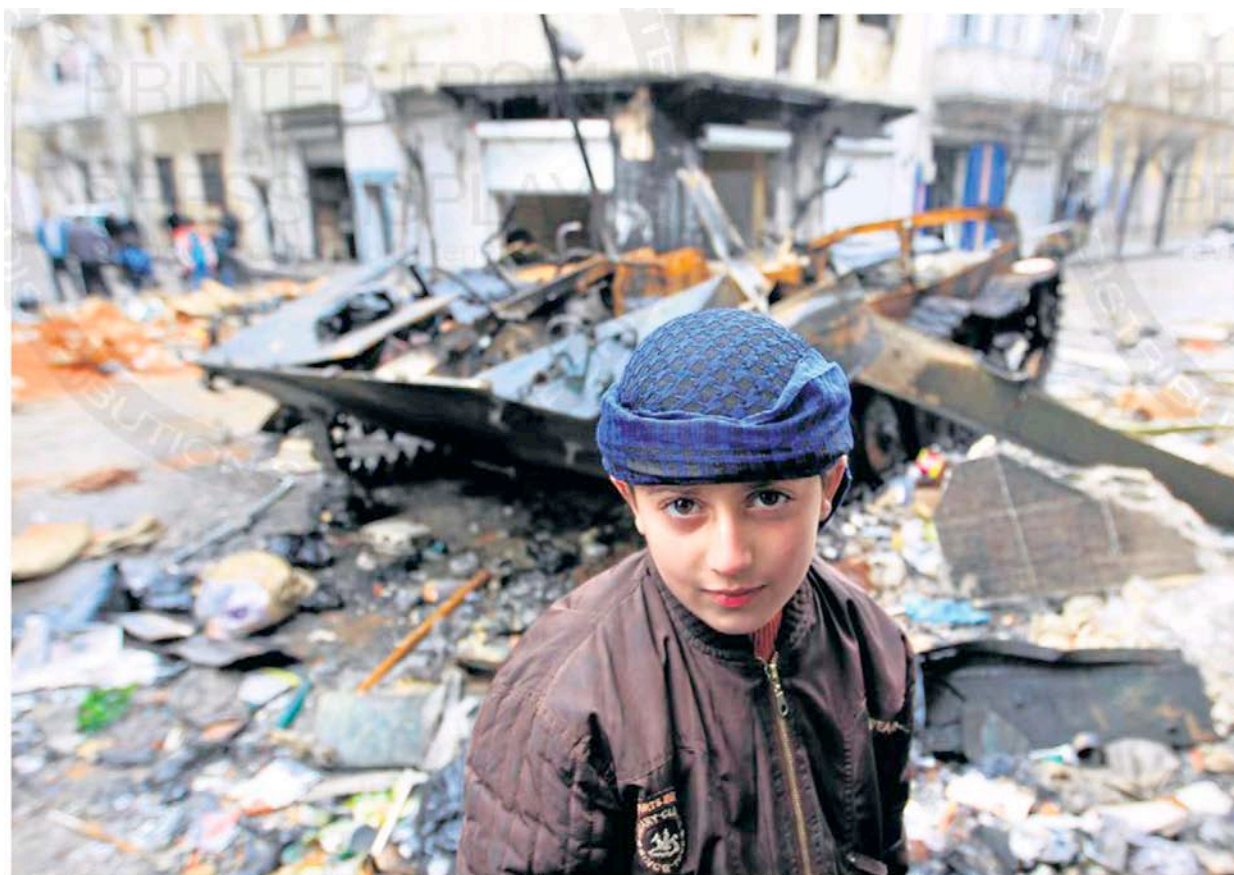
A Syrian boy in Homs stands in front of a damaged armoured vehicle belonging to the Syrian army on Monday. Syria called the Arab League's new plan 'a conspiracy.'