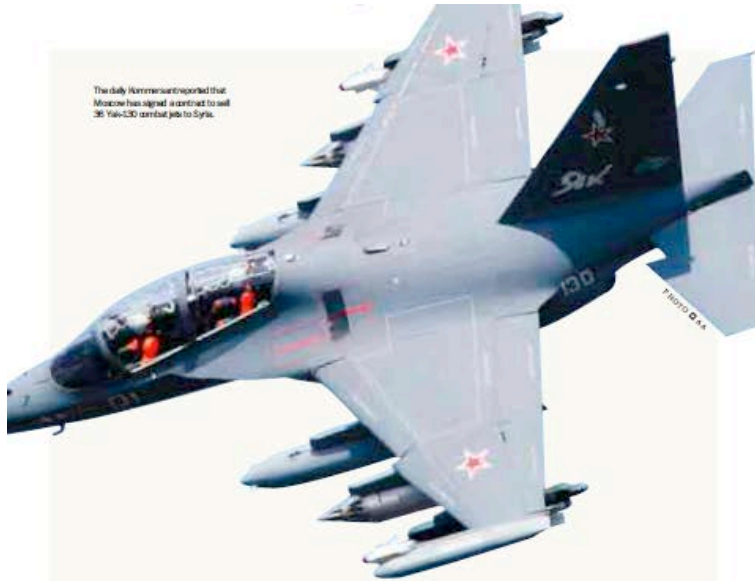
The daily Kommersant reported that Moscow has signed a contract to sell 36 Su-26 combat jets to Syria.